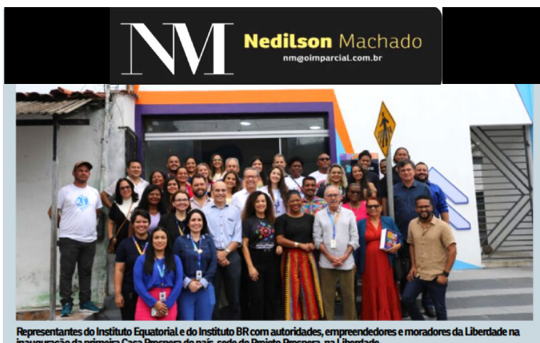
Representantes do Instituto Equatorial e do Instituto BR com autoridades, empreendedores e moradores da Liberdade na inauguração da primeira Casa Próspera do país, sede do Projeto Próspera, na Liberdade

O governador do Maranhão, Carlos Brandão, deu início a uma série de encontros com prefeitos e prefeitas eleitos e reeleitos do estado, na terça-feira (28), com o objetivo de fortalecer a parceria entre o Estado e os municípios. A meta é receber os gestores dos 217 municípios maranhenses para ouvir suas demandas e debater investimentos para o desenvolvimento local.