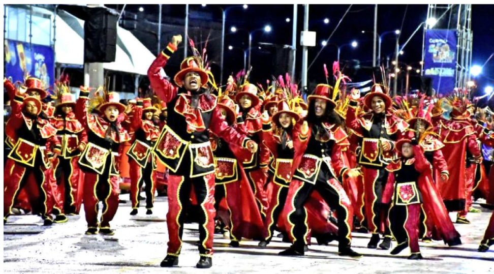
BLOCO TRADICIONAL ORIGINALS DO RITMO PARTICIPARÁ DE ABERTURA DA EXPOSIÇÃO

“Falar para o Maranhão, para o Brasil e para o mundo, do nosso Carnaval. Essa parceria foi buscar também nos grupos esse apoio para que acontecesse essa exposição, como o Centro de Cultura Negra, os Fuzileiros da Fu-