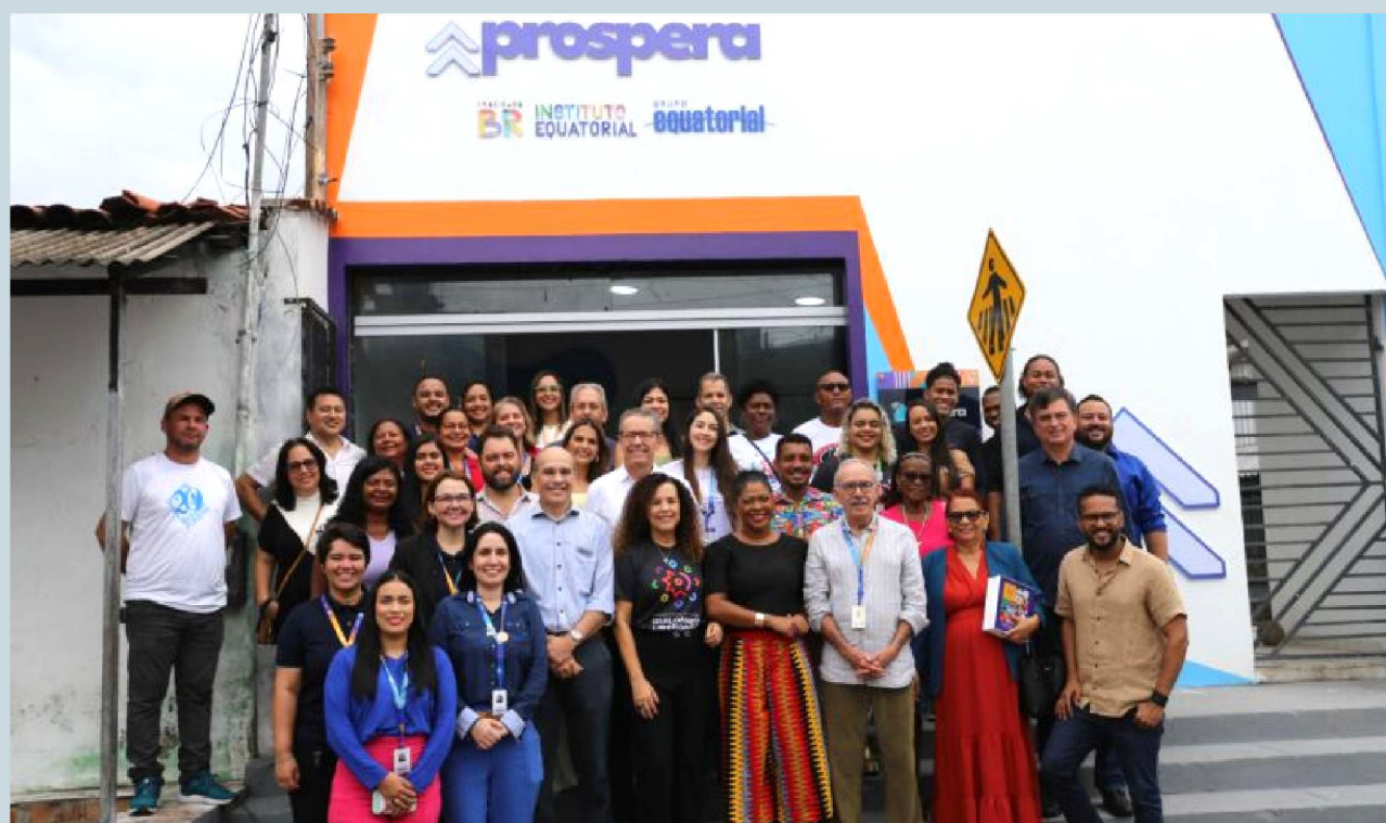
Representantes do Instituto Equatorial e do Instituto BR com autoridades, empreendedores e moradores da Liberdade na inauguração da primeira Casa Prospera do país, sede do Projeto Prospera, na Liberdade