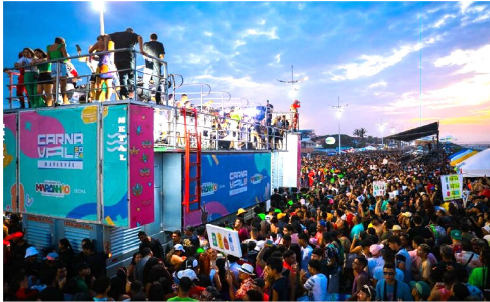
A EXPECTATIVA É REPETIR O SUCESSO DO ANO PASSADO E ATRAIR MAIS DE TRÊS MILHÕES DE FOLIÕES

dia de pré-Carnaval oficial do Governo do Maranhão: