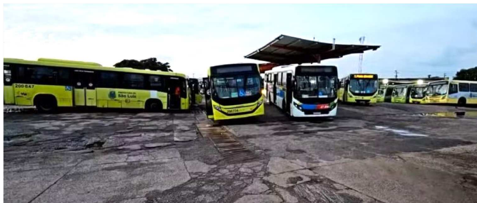
GREVE DOS RODOVIÁRIOS DEIXOU A GRANDE ILHA SEM TRANSPORTE COLETIVO

Além de determinar a manutenção de 80% da frota operante, a decisão judicial proibiu protestos como a "operação catraca livre" (transporte sem cobrança de passagens), "operação tartaruga" (circulação propositalmente lenta para causar congestionamentos) e bloqueios nas garagens das empresas. Caso a determinação não seja cumprida, o Sindicato dos Trabalhadores em Transportes Rodoviários no Estado do Maranhão (STTREMA)