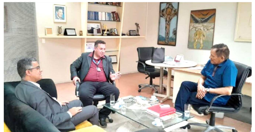
Na pauta da reunião: investimentos no Maranhão na área da agricultura familiar, microempreendedorismo, expansão das unidades, dentre outros assuntos

Lembrando que recentemente o Banco do Nordeste (BNB) anunciou a maior aplicação de sua história no Maranhão, com o total de R$ 7 bilhões investidos em empreendimentos de todos os segmentos produtivos em 2024. O volume de recursos aponta para uma alta de 7,5% com relação a 2023. Os resultados financeiros da instituição foram apresentados nessa terça-feira, 18, pela Diretoria Executiva. A maior fatia do orçamento operacionalizado pelo BNB é oriundo do Fundo Constitucional de Financiamento do Nordeste (FNE), por meio do qual foram destinados R$ 5,35 bilhões ao longo do último ano no estado, crescimento de 12% se comparado ao montante financiado em 2023, e terceiro maior volume investido de toda a área de atuação do Banco, que compreende a Região Nordeste e parte dos estados de Minas Gerais e do Espírito Santo.