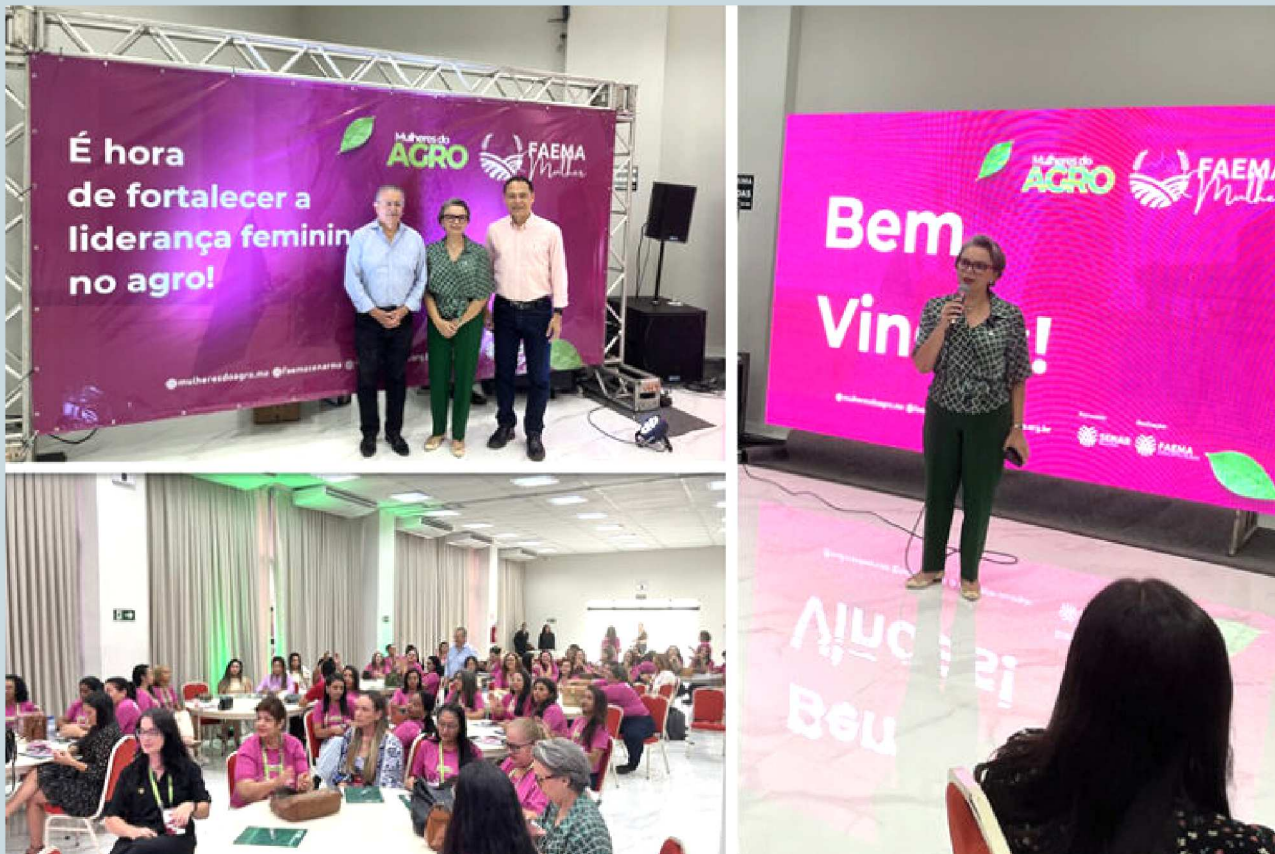
Diretoria do Sebrae Maranhão marcou presença no Encontro da Comissão de Mulheres do Agro do Maranhão, realizado pelo sistema Faema/Senar nesta segunda-feira (24)