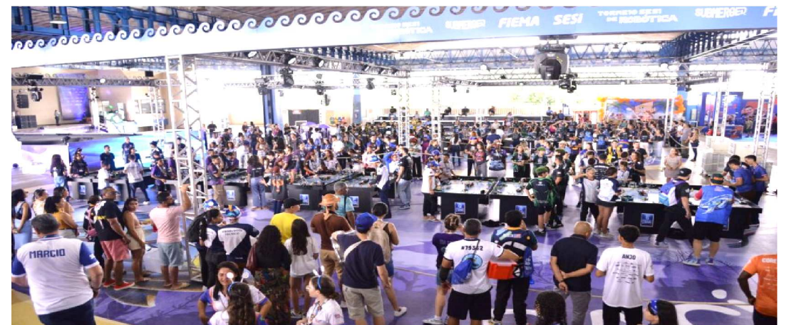
CENTENAS DE PESSOAS PRESTIGIARAM O EVENTO NO MULTICENTER SEBRAE

O projeto "Prototipando Sonhos" do SESI-MA é o maior programa de robótica em escolas públicas do Brasil, alcançando mais de 300 estudantes de 26 municípios maranhenses. A iniciativa tem democratizado o acesso à tecnologia e preparado jovens para competições e mercado de trabalho.