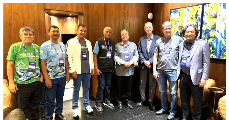
O presidente da FIEMA, Edilson Baldez, com o presidente da CNI, Ricardo Alban, o diretor superintendente do SESI nacional e demais membros das entidades

O delivery por aplicativo se consolidou como hábito de consumo no estado e atividade relevante para a economia do Maranhão. Segundo pesquisa realizada anualmente pela Fipe, publicada em 2024, a cadeia impactada pelas operações do iFood gera 12.219 postos de trabalho no estado, em diferentes setores, sendo responsável pela movimentação de 0,24% do PIB do Maranhão. São Luís apresentou alta de mais de 23% no total de pedidos em 2024, na comparação com 2023, e a capital está entre as 10 cidades do Nordeste com mais pedidos. Estes e outros dados relevantes sobre o ecossistema do iFood serão discutidos em um evento realizado pelo iFood em parceria com o Governo do Estado, Sebrae/MA e a Associação Brasileira de Bares e Restaurantes (ABRASEL). O "iFood Empreenda Maranhão" acontece na segunda-feira (17/03), no Convento das Mercês, em São Luís, e é voltado para pequenos e médios empreendedores donos de restaurantes já inscritos. O deputado federal Hildo Rocha (MDB/MA) participa do evento e irá palestrar sobre "A Reforma Tributária e o impacto do IVA Dual: desafios e oportunidades para os empreendedores brasileiros". O SEBRAE/MA e a Abrasel, parceiros do evento, dividem painel sobre inovação e como pequenos restaurantes podem se destacar num mercado competitivo. A iniciativa conta também com a presença do Especialista de Políticas Públicas do iFood, Lucas Moraes, entre outros convidados.