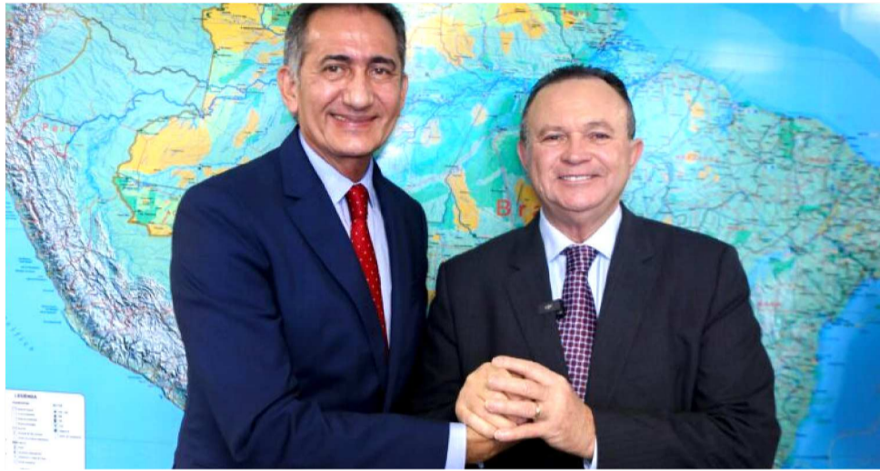
GOVERNADOR BRANDÃO E MINISTRO WALDEZ GÓES DIALOGARAM SOBRE VOÇOROCAS

Em Buriticupu, as crateras se formaram com a expansão urbana e o