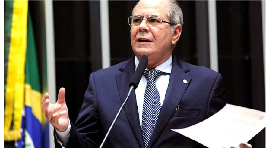
O deputado federal Hildo Rocha (MDB/MA) participa do evento e irá palestrar sobre "A Reforma Tributária e o impacto do IVA Dual: desafios e oportunidades para os empreendedores brasileiros".