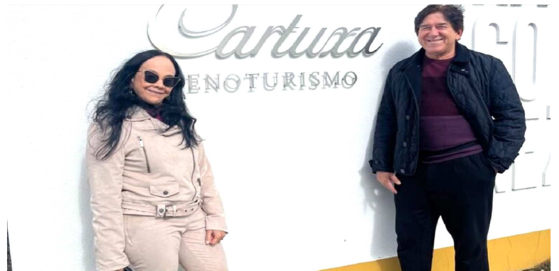
DESTINO ROMÂNTICO E GASTRONÔMICO, UMA EXPERIÊNCIA INESQUECÍVEL DO CASAL

Algarve, um paraíso à beira-mar, um lugar conhecido por suas praias paradisíacas e rica gastronomia.