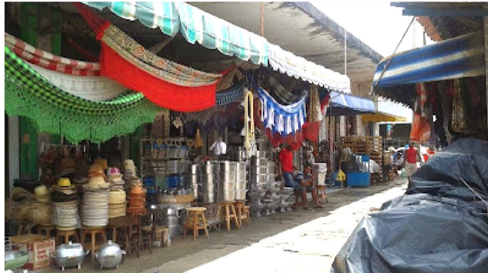
O MERCADO CENTRAL TEM MAIS DE 160 ANOS DE HISTÓRIA NA CAPITAL MARANHENSE

A comercialização destes produtos nunca foi interrompida e na sua área externa se concentram mercearias, joalherias e óticas, lanchonetes, armazéns que vendem cereais por atacado e dezenas de barracas que vendem calçados e redes de algodão. Alguns poucos bares ainda resistem, e outros ainda estão nas lembranças de