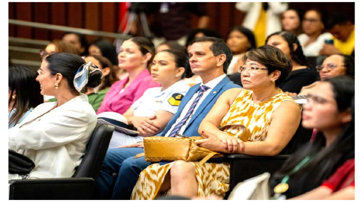
ALEMA CELEBROU O DIA INTERNACIONAL DA MULHER

Com essa participação, a FIEMA reforça seu compromisso com a valorização da mulher no setor produtivo e na construção de uma sociedade mais justa e inclusiva.