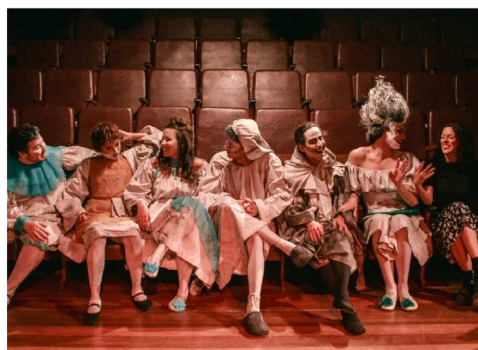
FESC – O evento é uma realização

"Ao descentralizar o acesso à arte, garante que municípios para além do eixo da capital, como Cantanhede, também possam ser protagonistas na cena teatral do estado. Como num cortejo vibrante, o "Abre-Alas" desta iniciativa convida todos a mergulharem na magia do palco, onde cada ato é um convite à emoção, à reflexão e ao encantamento".