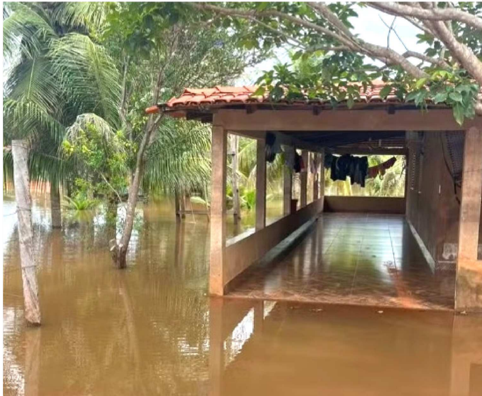
CHUVAS CAUSAM CHEIA DO RIO MEARIM GERANDO TRANSTORNOS EM PEDREIRAS

As cidades afetadas são: Formosa da Serra Negra, Grajaú, Presidente Vargas, Buriti Bravo, Pindaré-Mirim, Monção, Bom Jardim, Codó, Peri Mirim, Pedro do Rosário e Afonso Cunha. Entre as cidades que sofreram com enchentes causadas pelas fortes chuvas no estado durante a última semana, Pedreiras foi uma das mais afetadas por esta realidade.