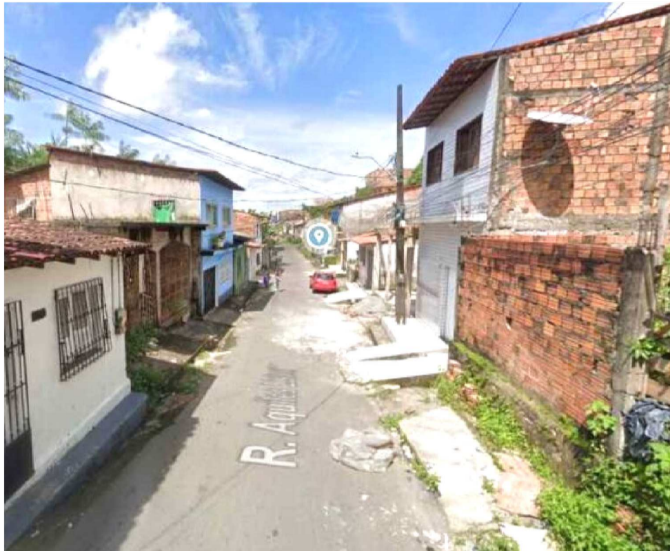
A RUA AQUILES LISBOA É UM DOS LOCAIS ONDE EXISTEM PONTOS DE RISCO