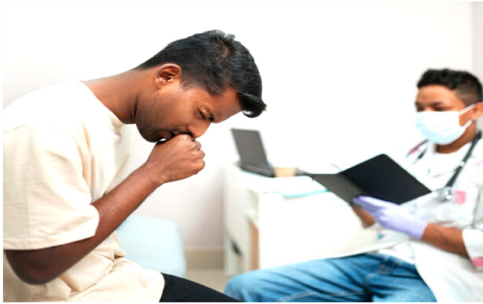
EM TRÊS MESES DE 2025, FORAM REGISTRADOS 440 CASOS E 9 ÓBITOS NO ESTADO

Nos três primeiros meses de 2025, já foram registrados 440 casos e 9 óbitos no estado.