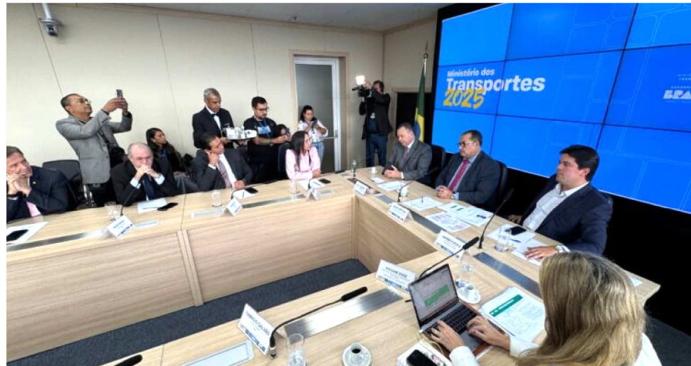
MINISTRO INTERINO ANUNCIOU QUE SERÃO R$ 50 MILHÕES DE INVESTIMENTOS

“Esse ato é fundamental porque consolida uma unidade entre a União,