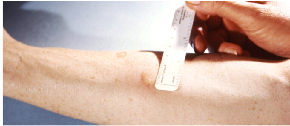
A TUBERCULOSE É UMA DOENÇA ALTAMENTE INFECTOCONTAGIOSA

A tuberculose é uma doença infectocontagiosa que afeta principalmente os pulmões, podendo também atingir ossos, rins e meninges. Segundo dados do Ministério da Saúde, o