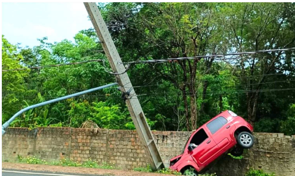
MAIS DE 160 COLISÕES COM POSTES DE ALTA TENSÃO FORAM REGISTRADOS NO ESTADO

Conforme atestam os números, o quantitativo de acidentes de trânsito envolvendo colisões com postes de alta tensão no Maranhão vem crescendo nos últimos anos. Apenas entre janeiro e fevereiro de 2025, a Equatorial Maranhão já registrou 167 casos em todo o estado. Os dados fornecidos pela assessoria de imprensa da distribuidora revelam um cenário preocupante, que há tempos coloca em risco não apenas a segurança dos motoristas, mas também o fornecimento de