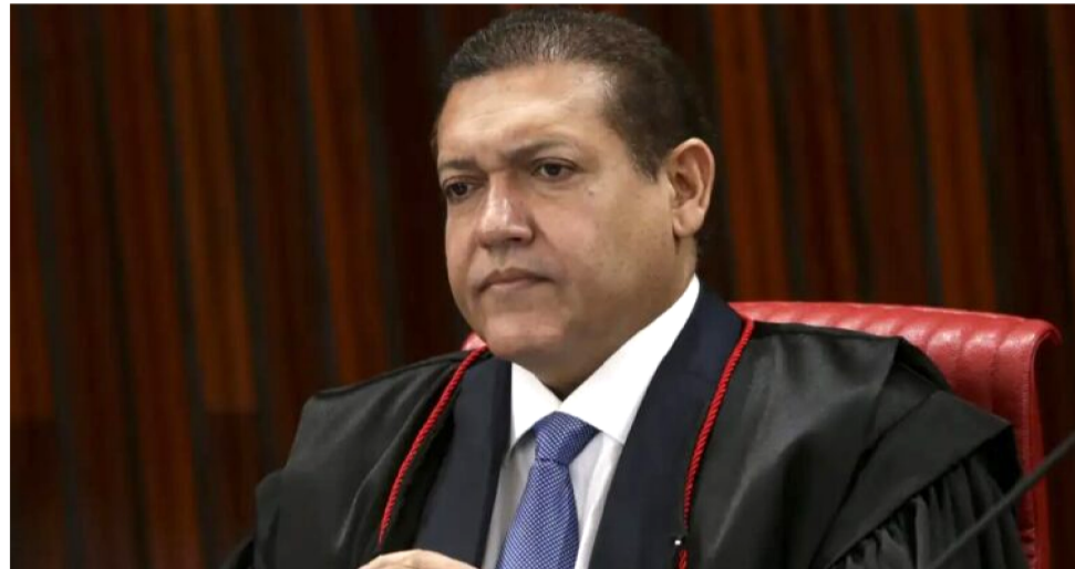
OVOTO DO MINISTRO NUNES MARQUES ACOMPANHANDO A RELATORA CÁRMEN LÚCIA

No plenário virtual do STF, o julgamento da ação foi retomado na sexta-feira (18/04), prosseguindo até o dia