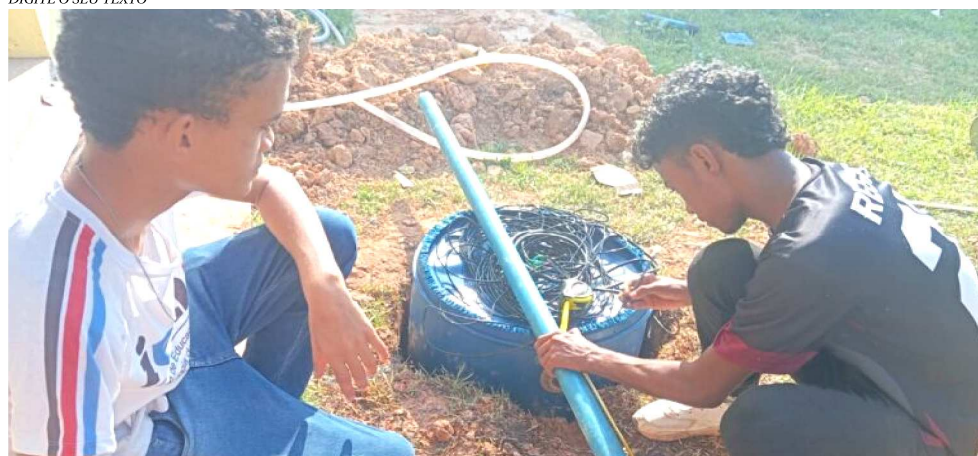
PROJETO FOI SELECIONADO ENTRE QUASE 1.600 DE 738 MUNICÍPIOS BRASILEIROS

cável para outras instituições de ensino no Brasil.