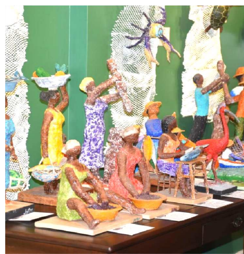
Uma das características das peças de

sobre tela, e 20 esculturas feitas de arame, isopor, papel, serragem de madeira, tinta e massa acrílica, que resultam num acabamento rústico e singular. “Eu venho do desenho, motivado pela curiosidade. Desenhando, rabiscando e depois passando a serrar madeira, esculpindo com faca, experimentando várias técnicas”, enfatizou.