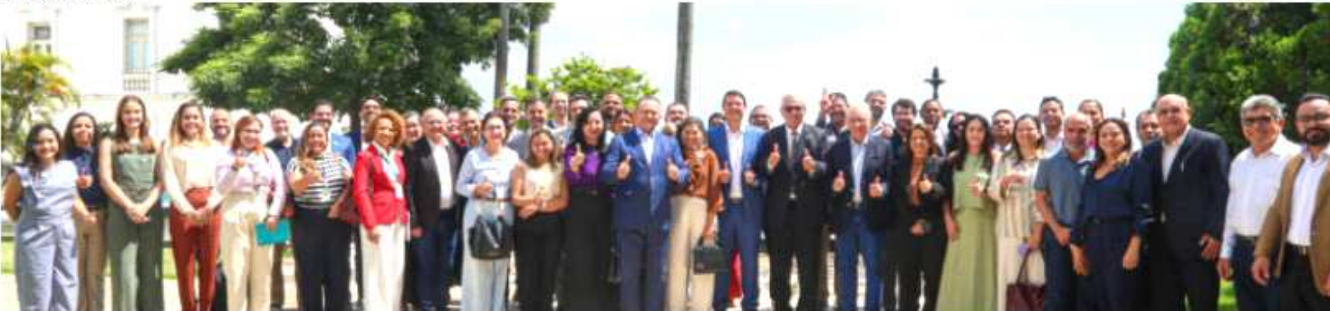
PLANO MARANHÃO 2050 VISA FORTALECER A ESTRATÉGIA DE PLANEJAMENTO DE LONGO PRAZO DO GOVERNO DO MARANHÃO

Diversos temas foram debatidos na reunião desta terça-feira como o Programa Maranhão Livre da Fome, da Secretaria de Estado de Monitoramento de Assuntos Governamentais (Semag), que é o maior programa social da história do Governo do Maranhão; a ampliação dos cursos graduação, bolsas de estágio e monitoria, da Universidade Estadual do Maranhão (Uema); e o Programa Cuidar de Todos, da Secretaria de Estado da Saúde (SES).