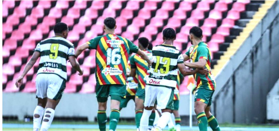
SAMPAIO BUSCA RESULTADO POSITIVO ESTA NOITE EM TERESINA