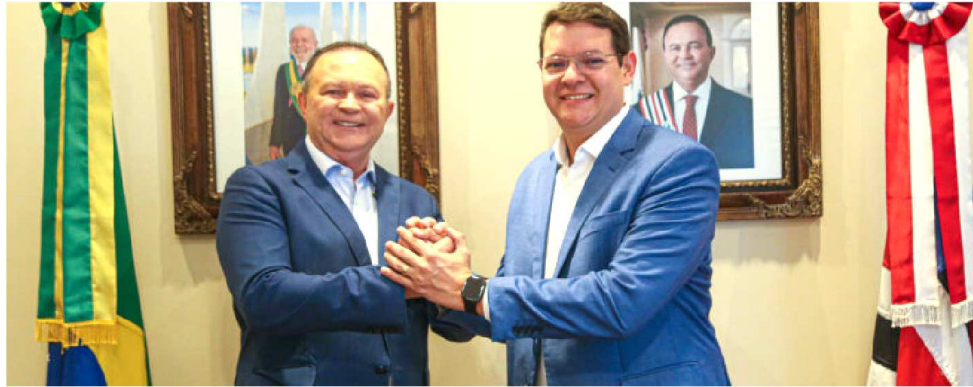
BRANDÃO E SECRETÁRIO DO PLANEJAMENTO E ORÇAMENTO, VINÍCIUS FERRO

plano de desenvolvimento a longo prazo, de modo que sejam criadas políticas de estado e não apenas de governo. Hoje, foi um dia de fazermos um balanço do que já foi realizado e estabelecermos metas para o que ainda falta sair do papel”, assinalou o governador Carlos Brandão.