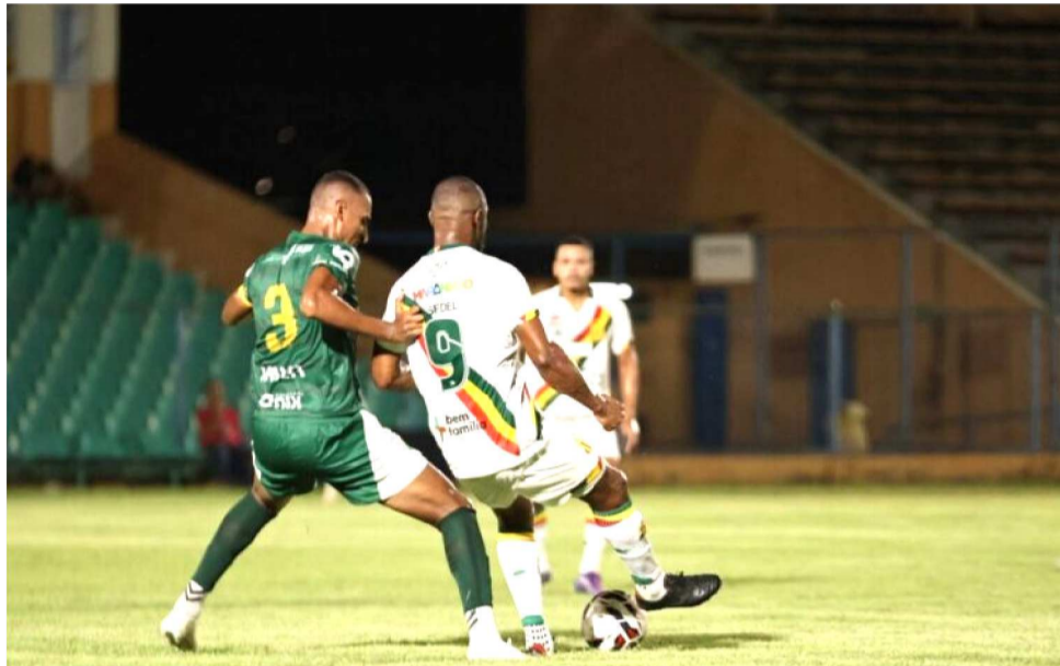
SAMPAIO, APÓS EMPATE COM O ALTOS, LUTA PARA SUBIR MAIS UMA POSIÇÃO

Para se manter no terceiro lugar, porém, o time maranhense vai torcer para que o Iguatu não seja vencedor nesta sexta-feira, quando estará enfrentando o Tocantinópolis, no interior cearense, às 19h. Até o empate deixará a equipe tricolor, se vencer, em vantagem sobre o concorrente, ao final da nona rodada. Mais abaixo, aparece o Parnahyba-PI com 9 pontos. O time piauiense receberá o Maranhão Atlético (8 pontos) no próximo do-