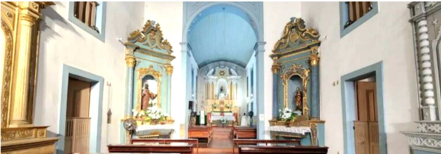
IGREJA FAZ PARTE DO CONVENTO QUE RECEBEU A VISITA DO PAPA JOÃO PAULO II EM 1991, QUANDO O PONTÍFICE PERNOITOU NA ILHA

A história da Igreja de Santo Antônio remonta a 1624, quando o frei franciscano Cristóvão de Lisboa iniciou a construção do convento, junto à antiga Capela Bom Jesus dos Navegantes — esta, por sua vez, erguida ainda antes, em 1613, por capuchinhos franceses. Ao longo dos séculos, o conjunto arquitetônico teve papel central na vida religiosa e política da cidade.