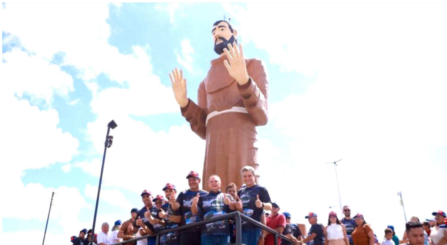
“VAMOS MANDAR PARA CÁ UMA AMBULÂNCIA NOVINHA, ZERO QUILOMETRO”, DISSE O GOVERNADOR DURANTE O SEU DISCURSO

Entre as novidades para o município, Carlos Brandão anunciou a destinação de uma nova viatura policial para reforçar o sistema de segurança pública e uma nova ambulância para São João dos Patos.