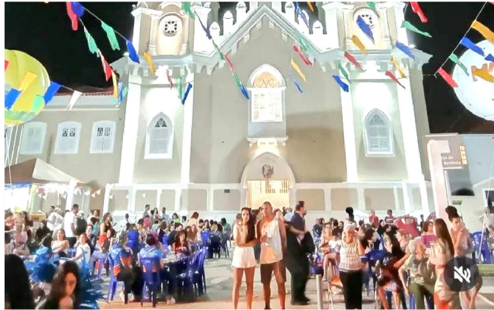
REFORMA DA IGREJA DE SANTO ANTONIO RECEBEU RECURSO DE R$ 4,5 MILHÕES

A restauração foi viabilizada por meio de um termo de cooperação técnica firmado entre o Governo do Maranhão e o Governo Federal, por intermédio do Instituto do Patrimônio Histórico e Artístico Nacional (Iphan). O documento, assinado em 2023 pelo governador Carlos Brandão e pelo presidente do Iphan, Leandro Grass, no Palácio dos Leões, marcou o início