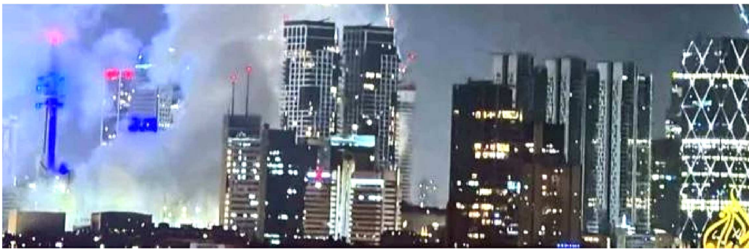
IRÃ REVIDA E FAZ ATAQUES ISRAEL, APÓS BOMBARDEIO NA MADRUGADA DESTA SEXTA