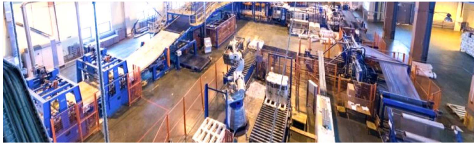
VOLUME DE PRODUÇÃO CRESCER 5,1 PONTOS EM RELAÇÃO AO MÊS ANTERIO

A utilização da capacidade instalada também avançou, subindo 4,0 pontos e alcançando 69,0 pontos, demonstrando maior intensidade no uso do maquinário industrial. O nível de estoques de produtos teve cresci-