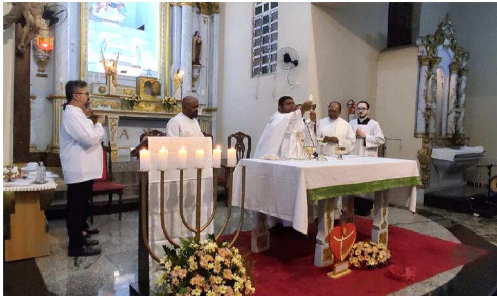
FESTA DE SÃO JOÃO COMEÇA DIA 15 COM NOVENÁRIO DO JUBILEU DA JUVENTUDE

Dos dias 16 a 18 as missas serão celebradas na Igreja de Santana, no Centro, às 19h, após o Terço. No dia 19, toda a programação é voltada para o dia de Corpus Christi no Estádio Castelão. O ponto alto do festejo acontece no dia 24, dia de São João