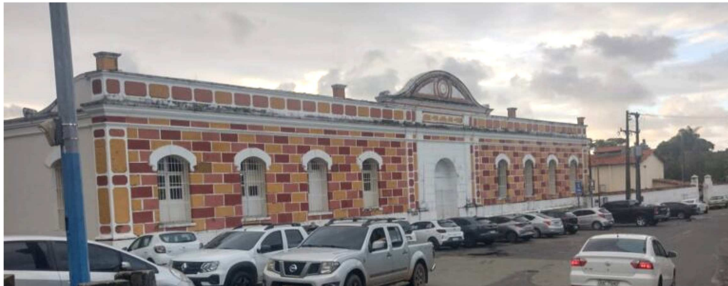
NO FINAL DO SÉCULO XIX, A COMPANHIA DE FIAÇÃO E TECIDOS CÂNHAMO FOI A PRIMEIRA FÁBRICA CONSTRUÍDA NO BAIRRO