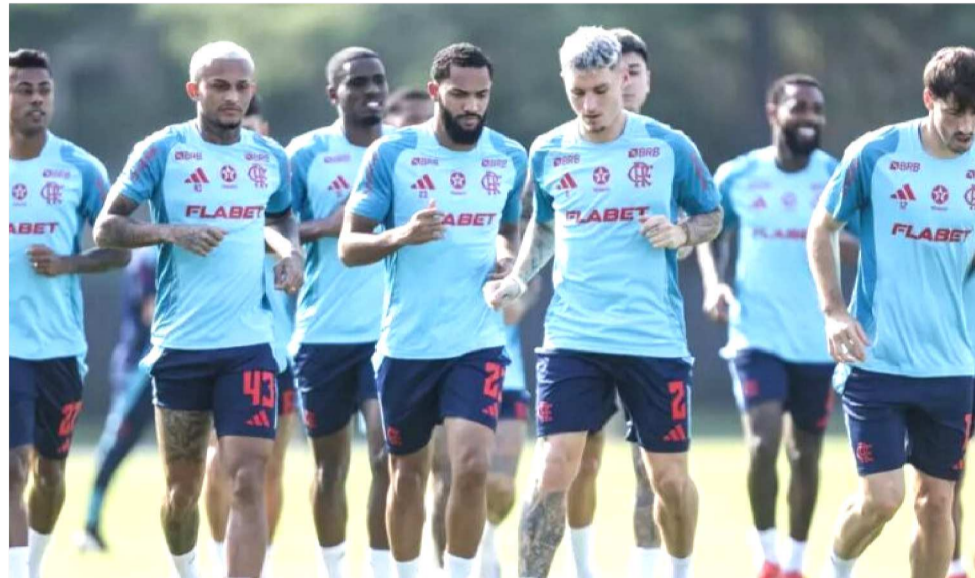
JOGADORES DO FLAMENGO DURANTE TREINAMENTO VISANDO O PRIMEIRO DESAFIO

Vale destacar que o adversário tunisiano vem embalado por uma sequência de 11 jogos sem perder, somando compromissos pela Champions da África, Liga da Tunísia e Taça da Tunísia. Além disso, na terceira rodada, o Mengão enfrentará o Los Angeles FC, que também ostenta uma sólida invencibilidade: são 10 partidas sem derrotas. Por isso, o time comandado por Filipe Luís terá que lidar com rivais que vivem grande fase técnica e psicológica.