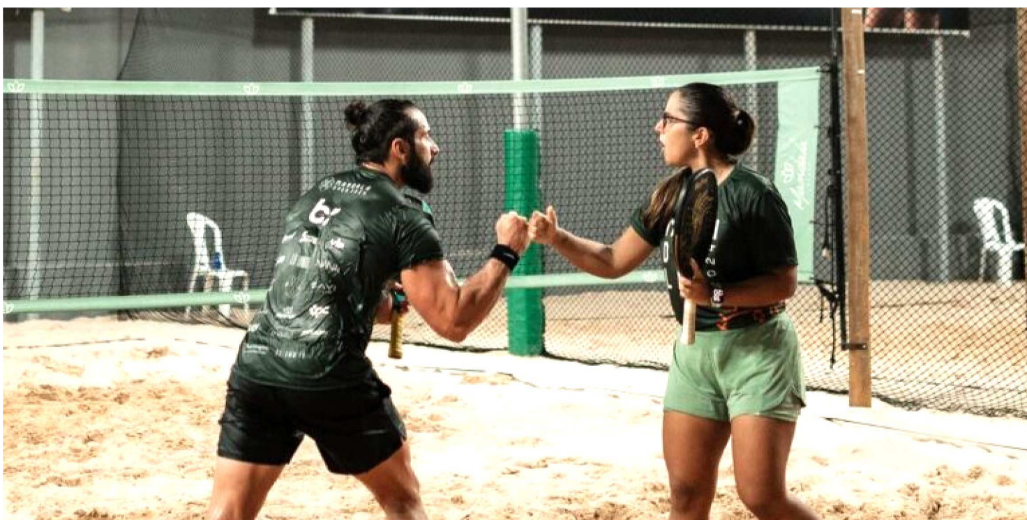
TENISTAS SE PREPARAM PARA COMPETIÇÃO ESTADUAL NO MANDALA OPEN

Estão abertas as inscrições para o Mandala Open, torneio que corresponde à 5ª etapa do Campeonato Maranhense Oficial de Beach Tennis, competição chancelada pela Federação de Beach Tennis do Maranhão (FBTM), entidade que representa oficialmente a modalidade no Estado. O evento será realizado entre os dias 26 e 29 de junho, em São Luís, onde estarão em disputa pontos para os rankings estadual e nacional.