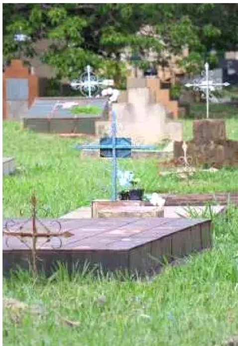
Os cemitérios públicos em questão são: Gavião, Anjo da Guarda/São Raimundo, Vila Embratel, Vila Maranhão, Maracanã, Turu, Tibiri, São Cristó-