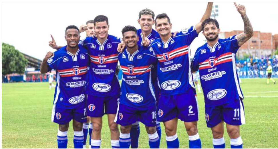
O CAMPEÃO MARANHENSE VAI ENFRENTAR O SAMPAIO CORRÊA NO PRÓXIMO SÁBADO

A zaga do MAC está entre as mais vazadas, junto com o Parnahyba (11) e Maracanã (lanterna), que já deixou passar 13 bolas. Enquanto isso, o ataque é o segundo melhor do grupo,