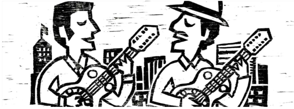
EVENTO FOMENTA A LITERATURA DE CORDEL E PRESTIGIA CORDELISTAS MARANHENSES

A tarde será uma mistura de gerações: o grupo de idosos “Perseverança” se une às crianças de um grupo de reforço escolar para celebrar a arte do cordel. Toda a programação é aberta ao público. E se alguém da plateia ti-