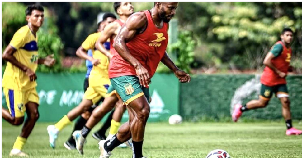
SAMPAIO TEM QUE VENCER CLÁSSICO E SECAR O IMPERATRIZ PARA FICAR NO 2º LUGAR

Hoje o Sampaio Corrêa tem 13 pontos, 3 vitórias, 9 gols marcados e 6 sofridos, saldo positivo de 3 gols. Pode chegar a 16 pontos. O Imperatriz já soma 15 pontos, 4 vitórias, 9 gols marcados e 9 sofridos, saldo zero. Um empate do Cavalão de Aço e uma vitória do Tricolor deixará os dois times iguais na pontuação e no número de vitórias, mas a equipe da capital assu-