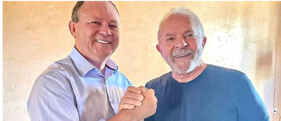
GOVERNADOR CARLOS BRANDÃO CONVIDOU PRESIDENTE LULA PARA A CERIMÔNIA

Localizado no estado do Maranhão, o parque é conhecido por suas extensas dunas brancas intercaladas com lagoas de água doce formadas pelas chuvas sazonais — uma combinação rara, quase mágica, que o transforma em um ecossistema único. Essa beleza natural, aliada à biodi-