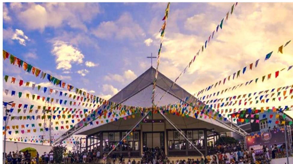
A CAPELA DE SÃO PEDRO RECEBE MUITOS FIÉS E GRUPOS DE BUMBA-MEU-BOI

No Maranhão, em época junina, o respeito pela tradição popular se mistura à devoção dos fiéis, gerando momentos inesquecíveis ora para os próprios maranhenses, ora para turistas que chegam ao estado repletos de curiosidade e o deixam encantados pelas belezas que só aqui se encontram. No período, são destaques os festejos de Santo Antônio, São João, São Marçal e, claro, o de São Pedro, costume mantido há mais de 80 anos, em que milhares de pessoas amanhecem na Capela que leva seu nome, em São Luís. O momento exige muita resistência, não somente dos devotos e ex-