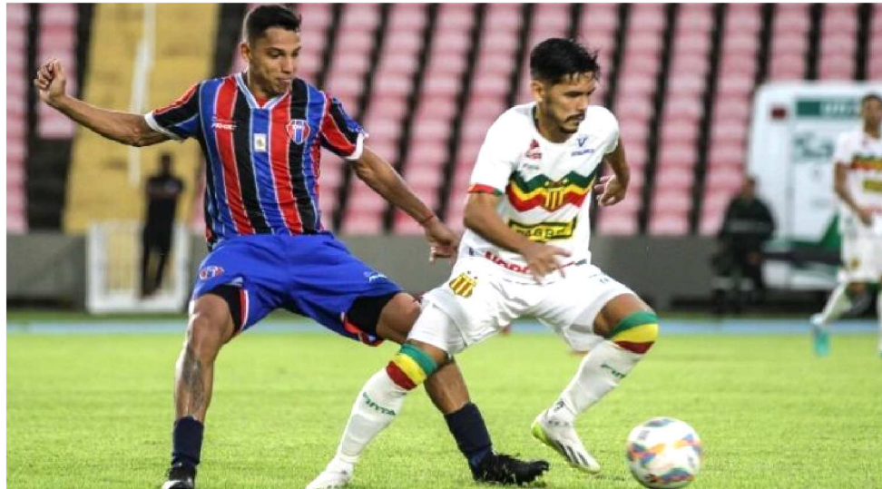
SAMPAIO E MARANHÃO ATLÉTICO SE ENFRENTAM NESTE SÁBADO PELA SÉRIE D

O Maranhão (9 pontos) só entra no G4 em caso de derrotas do Iguatu (11) para o Altos, e do Tocantinópolis (11) para o Cavalo de Aço. Além disso, torce para o fracasso do Parnahyba (10) diante do Maracanã, fora de casa,