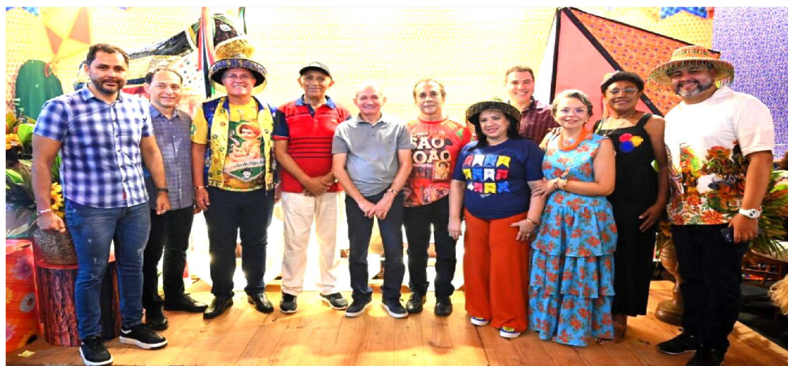
SÃOJOÃO DO SESI-MA FOI MUITO PRESTIGIADO E ATRAIU GRANDE PÚBLICO

O Galpão da Indústria, espaço exclusivo para micro e pequenas empresas, dos setores de alimentos, bebidas e vestuário, chamou a atenção do público ao oferecer produtos regionais, que evidenciaram a força da indústria maranhense.