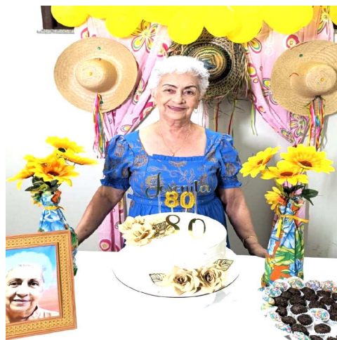
D. JOSENITA NO CLIMA DO SÃO JOÃO