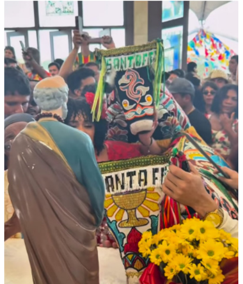
Um dos momentos mais aguardados do São João do Maranhão é o encontro de Bumba Bois na Capela de São Pedro, que reuniu milhares de turistas, devotos e centenas de brincantes em comemoração ao Dia de São Pedro. O público acompanhou a celebração, que uniu cultura e religiosidade.

Um dos momentos mais aguardados do São João do Maranhão é o encontro de Bumba Bois na Capela de São Pedro e Desfile do Jo'ao Paulo, que reúne milhares de turistas, devotos e centenas de brincantes todos os anos. No domingo durante toda a madrugada e manhã, os grupos de Bumba Boi do Maranhão, que se apresentaram pela região metropolitana, fizeram um cortejo na Capela de São Pedro. E hoje, segunda-feira, Dia Nacional do Bumba Meu Boi, feriado municipal e ponto facultativo estadual, oportunidade em que milhares de pessoas se reúnem no tradicional encontro dos batalhões de bois de matraca, que está perto de completar 100 anos no Bairro do Joao Paulo. Serão homenageados três personagens da cultura 'in memoriam'. A concentração terá o nome do cantor Petinha; a área do desfile se chamará João Chiador; e a área do palco, Humberto de Maracanã, todos cantadores de renome