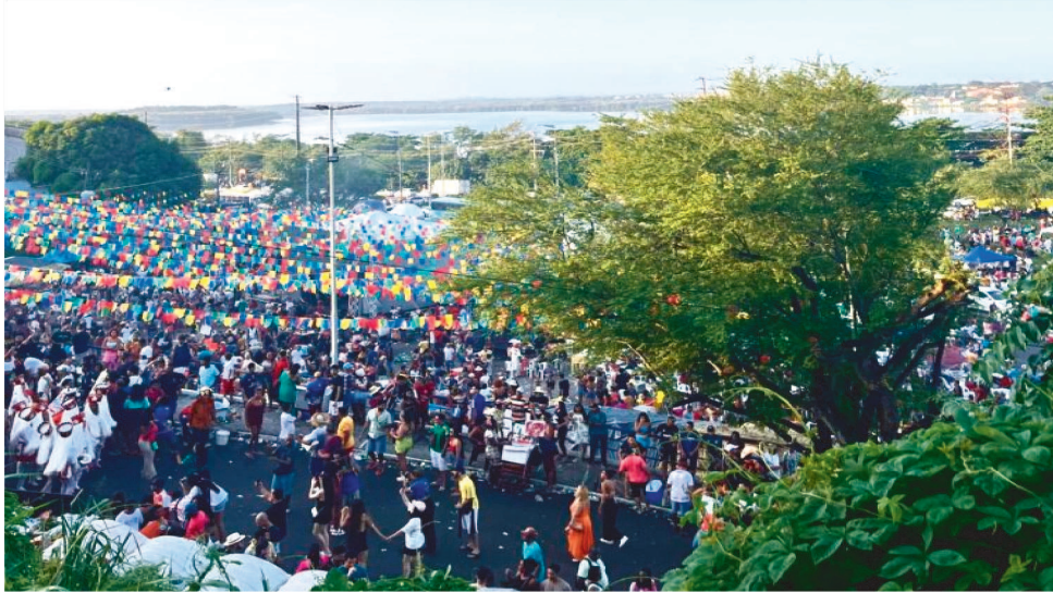
A PLURALIDADE DE PONTOS DE VISTA PERMEIAM O PERÍODO JUNINO

O São João do Maranhão é uma festa plural. Com histórias que o permeiam e o enchem de magia, quem nasce