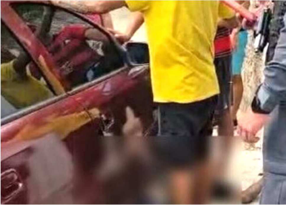
POPULARES AGREDIR A VÍTIMA, NO BAIRRO DA FORQUILHA, EM SÃO LUÍS

A Polícia Civil do Maranhão investiga o caso e busca identificar os res-