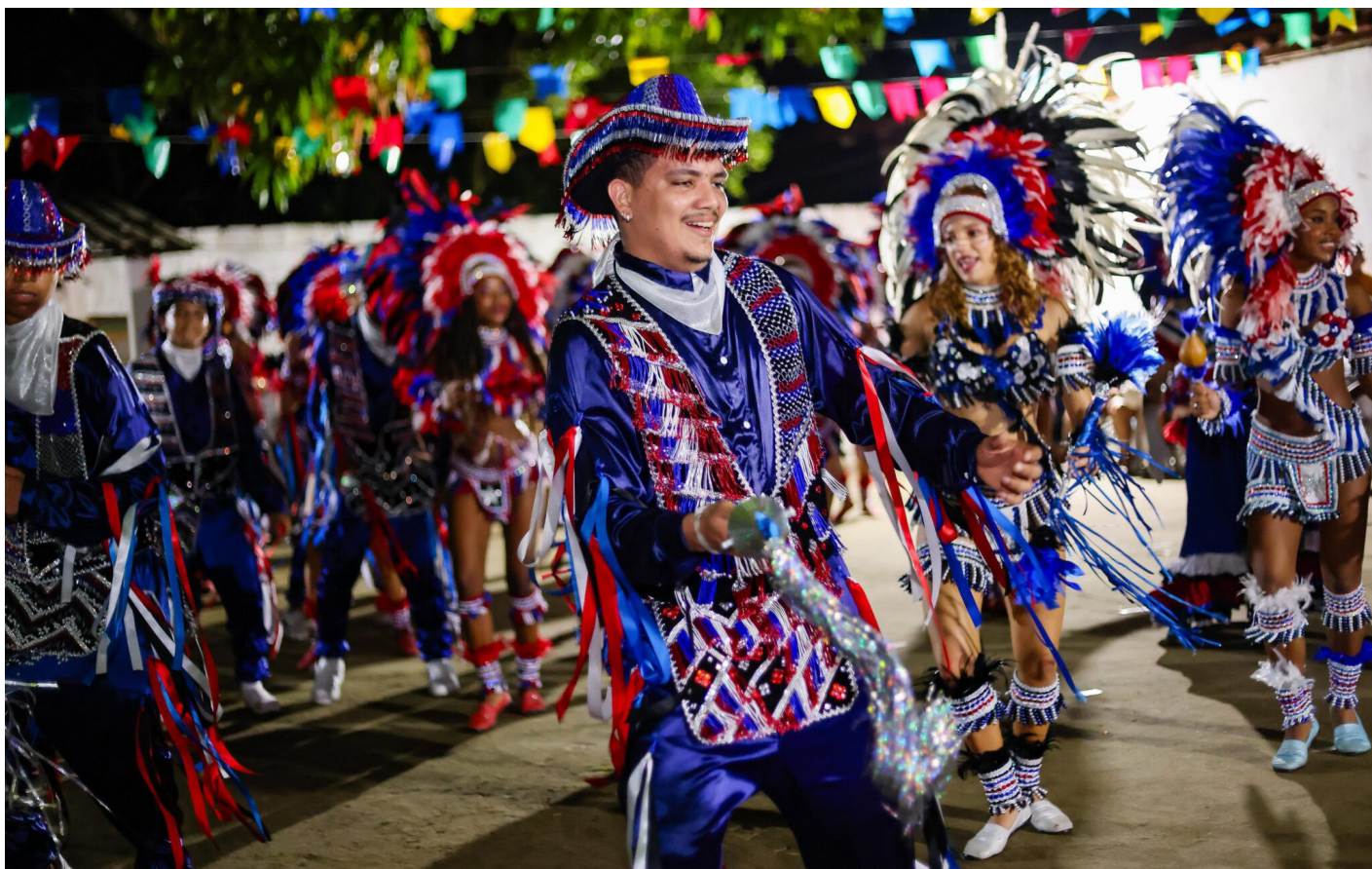
Entre danças, cantos e rituais, personagens como o vaqueiro campeador mantêm viva a memória coletiva do povo maranhense durante o período de São João

O governador Carlos Brandão anunciou nesta segunda-feira (30) que o reajuste salarial para todos os níveis da Polícia Militar do Maranhão (PMMA) e do Corpo de Bombeiros Militar (CBMMA) chegará a 20%. Com isso, o Maranhão passa de 17º para 11º no ranking nacional e para 3º no ranking do Nordeste. O anúncio foi feito por meio das redes sociais do governador Carlos Brandão, que informou, ainda, que o aumento salarial será em duas etapas: uma em julho e a outra em dezembro de 2025