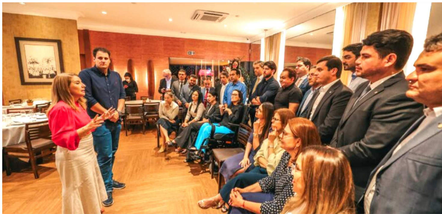
REUNIÃO DA BASE GOVERNISTA DA ASSEMBLEIA LEGISLATIVA CONTOU COM A PRESENÇA DA PRESIDENTE IRACEMA VALE

O cenário político do Maranhão começa a ganhar novos contornos rumo às eleições de 2026. Em movimento articulado nos bastidores, parlamentares que integram a base do governador Carlos Brandão (PSB) na Assembleia Legislativa declararam, de forma unificada, preferência pelo nome de Orleans Brandão (MDB) como pré-candidato ao governo do Estado.