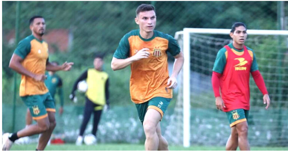
TRICOLOR INTENSIFICA OS TREINOS, VISANDO O DIFÍCIL DUELO CONTRA O IMPERATRIZ

mados aos 13 já conquistados chegarão a 25. Se vencer os compromissos marcados para São Luís, o Tricolor chegará a 22 pontos e estará matematicamente classificado. A vaga poderá ser garantida até mesmo com duas vitórias e um empate, o que totalizará 20 pontos, dependendo do desempe-