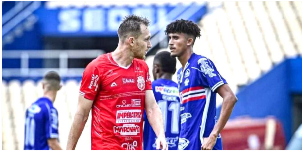
MARANHÃO TERÁ DIFÍCIL COMPROMISSO DIANTE DO IMPERATRIZ

A situação do MAC é a mais difícil, porque o time parou nos 13 pontos. Pode ainda chegar aos 22, mas para atingir seu objetivo terá de vencer todos os jogos restantes. Os próximos adversários dos atleticanos serão o Imperatriz, no próximo sábado, no Frei Epifânio, depois enfrentará o Maracanã, em São Luís, e fará a última partida diante do Altos-PI, em Teresi-