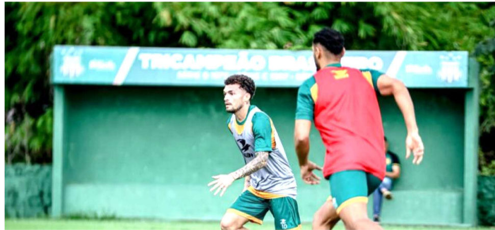
SAMPAIO ESTÁ SE PREPARANDO PARA ENFRENTAR O TOCANTINÓPOLIS

ALTOS: 23 pontos. Joga contra Parnahyba (em casa), Tocantinópolis (fora) e MAC, em casa. IMPERATRIZ: