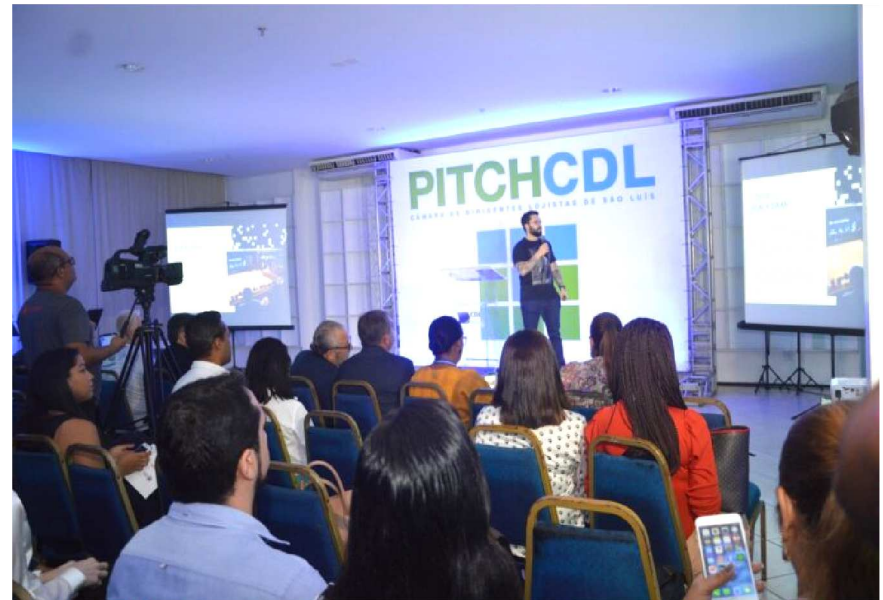
Durante o PITCH, empresas têm um tempo para apresentar seus negócios e serviços, gerando oportunidade de negócios