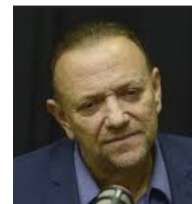
Edinho Silva é eleito novo presidente nacional do PT