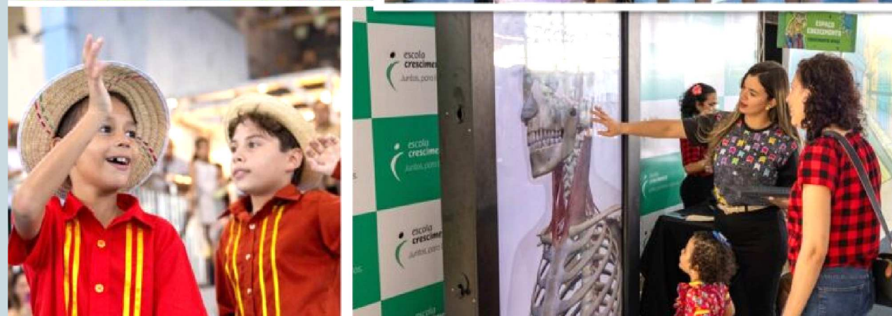
"Este momento celebra a união entre escola, família e comunidade, mantendo vivas as nossas raízes e reafirmando a identidade cultural que nos orgulha"