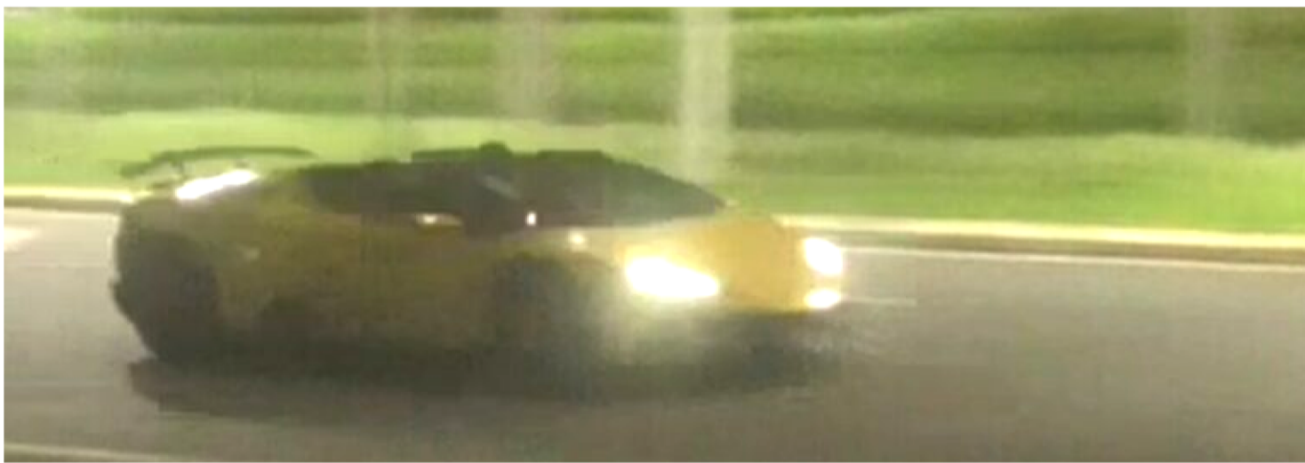
UM DOS VEÍCULOS IDENTIFICADOS NA PRÁTICA DE “PEGAS” EM AVENIDAS DA CAPITAL.

Na madrugada desta quinta-feira (10), o Ministério Público do Maranhão deflagrou uma operação contra rachas e “pegas” ilegais em avenidas de São Luís. A ação foi conduzida pela 2ª Promotoria de Justiça de Controle Externo da Atividade Policial, em parceria com a Polícia Civil, Polícia Militar e SMTT.