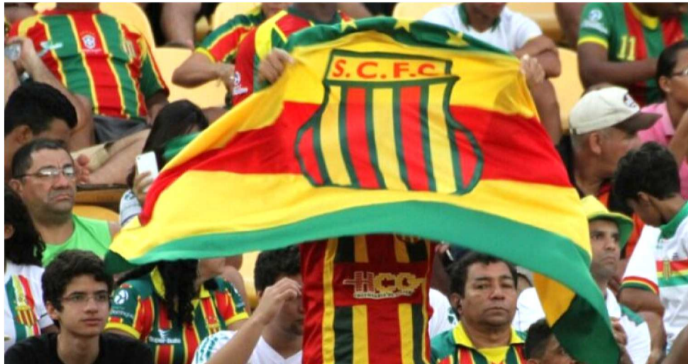
TORCIDA TRICOLOR É CONVOCADA PARA JOGO IMPORTANTE NO CASTELÃO