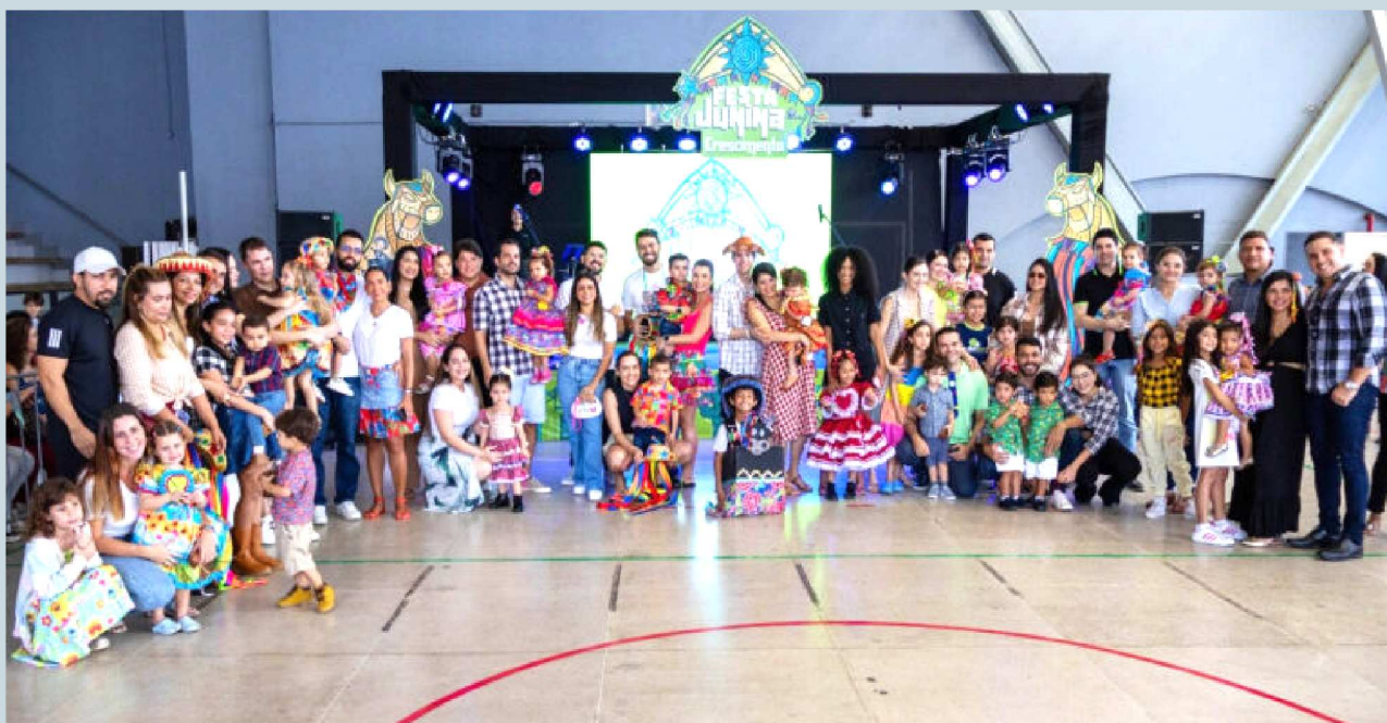
A diretoria da escola reunida com alunos e seus familiares para a foto oficial do evento