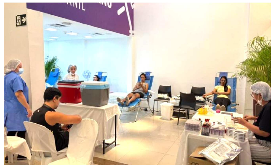
Além de salvar vidas, doar sangue também traz benefícios para quem doa. A prática estimula a produção de novas células sanguíneas, contribui para o bom funcionamento do organismo e pode até ajudar a detectar possíveis problemas de saúde, já que o sangue coletado passa por uma triagem rigorosa.