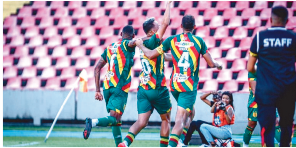
O SAMPAIO É A EQUIPE QUE ESTÁ MAIS PRÓXIMA DA CLASSIFICAÇÃO

cado, com 19 pontos. Pode chegar a 25 e ficar com o segundo lugar. Próximos jogos: Parnahyba (fora) e Iguatu, em São Luís. Com 14 pontos, o Iguatu-CE é o terceiro colocado. Ainda jogará contra Imperatriz (em casa) e Sampaio Corrêa fora. No 5º lugar está o Parnahyba, com 13 pontos. Vai enfrentar Sampaio (em casa) e Impera-