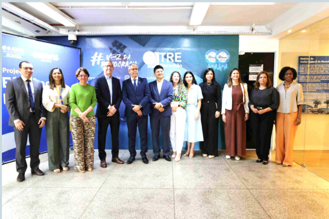
A solenidade de assinatura do Termo de Cooperação entre o TRE-MA e a Equatorial Maranhão reuniu os parceiros na sede do Tribunal Regional Eleitoral do Maranhão. A iniciativa foi contemplada pela Chamada Pública de Projetos 01/2024, reforçando o compromisso da distribuidora com práticas sustentáveis e responsabilidade socioambiental.