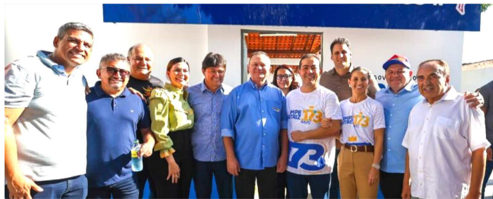
DURANTE AS COMEMORAÇÕES DA CIDADE GOVERNADOR ENTREGOU VÁRIAS OBRAS

“É tanta obra para entregar que só um dia é muito pouco e uma das mais importantes obras de Imperatriz entregamos hoje, que é a Avenida Nicolau Dino. Também tivemos outras inaugurações, como o Centro de Ensino de Jovens e Adultos (Ceja), que há 30 anos não tinha uma reforma. Entregamos também a reforma da Unidade Regional de Educação (URE). Estamos sempre em parceria com a Prefeitura de Imperatriz e vamos inaugurar várias outras obras”, declarou o governador Carlos Brandão.