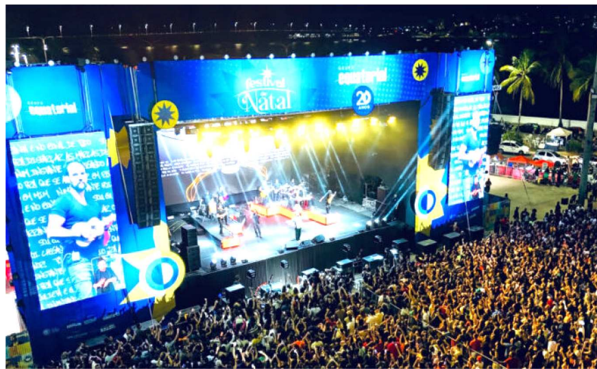
Projetos culturais e esportivos terão investimento de até R$ 17 milhões

De hoje (23) até domingo (27), o São Luís Shopping será o centro da cultura popular maranhense, recebendo a segunda edição do Arraial Pão com Ovo. Com entrada gratuita e programação das 18h às 22h, o evento promove uma grande celebração das tradições do Maranhão com apresentações culturais, shows, comidas típicas e um espaço cenográfico inédito inspirado na comédia teatral que conquistou o país. Realizado no estacionamento do shopping, o arraial é uma iniciativa da Santa Ignorância Companhia de Artes, em parceria com a Alegria Produções e apoio do próprio São Luís Shopping. Inspirado na comédia Pão com Ovo, o evento resgata a força das expressões populares do Estado, reunindo batalhões tradicionais de Bumba Meu Boi, grupos de tambor de crioula, cacuriá, quadrilhas e shows de artistas maranhenses. A grande novidade deste ano é a montagem de um espaço cenográfico temático, que recria ambientes icônicos da peça — como a cozinha da Dijé e a sala da Clarisse — permitindo ao público interagir com o universo afetivo da comédia.