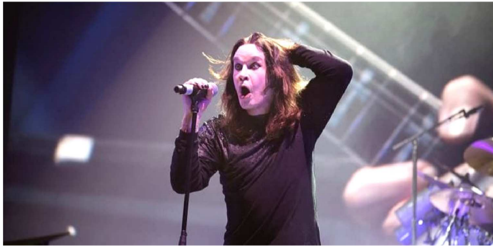
O CANTOR LUTAVA HÁ ANOS COCONTRA A DE SEQUELAS DA DOENÇA DE PARKINSON

Figura amada e venerada pela cena do rock and Roll, Ozzy é conhecido como a voz do início do heavy metal. Os timbres e a levada do Black Sab-