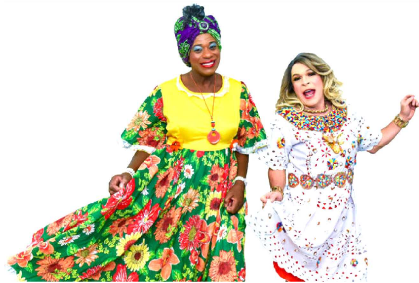
Inspirado na comédia Pão com Ovo, o evento resgata a força das expressões populares do Estado, reunindo batalhões tradicionais de Bumba Meu Boi