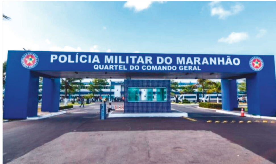
A VÍTIMA AFIRMA QUE O CRIME ACONTECEU DENTRO DO BATALHÃO DA PM

Ao relatar o caso às autoridades, a mulher solicitou uma medida protetiva de urgência, alegando estar sendo intimidada pelo oficial após o ocorrido. A Polícia Militar informou, por meio de nota oficial, que o policial foi imediatamente afastado das funções operacionais e que um inquérito foi instaurado para apurar os fatos. Leia na íntegra. "A Polícia Militar do Maranhão (PMMA) informa que ao tomar conhecimento dos fatos, determinou de imediato ao comando da região o afastamento do policial das atividades operacionais no Batalhão. Foi instaurado Inquérito Policial Militar para apuração rigorosa e célere das denúncias.