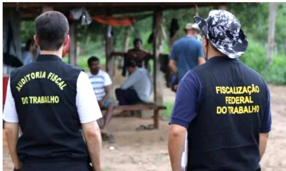
ENTRE 2003 E 2021, O ESTADO REGISTROU 8.636 TRABALHADORES RESGATADOS

A crise se aprofunda com a precarização da fiscalização. O Maranhão está entre os estados com menor presença de Auditores-Fiscais do Trabalho, o que resulta em subnotificação de casos, demora nas inspeções e tra-