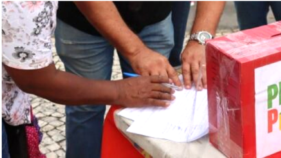
MOBILIZAÇÃO SEGUE ATÉ SETEMBRO, COM A INSTALAÇÃO DE URNAS EM TODO O PAÍS

A mobilização segue até setembro, com a instalação de urnas em todo o território nacional. Em São Luís, há diversos pontos fixos de votação espalhados pelo centro (confira lista abaixo). As informações sobre como participar, cadastrar, localizar urnas ou organizar uma coleta de votos em seu bairro ou comunidade estão disponí-