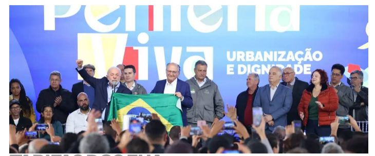
TARIFAS DOS EUA