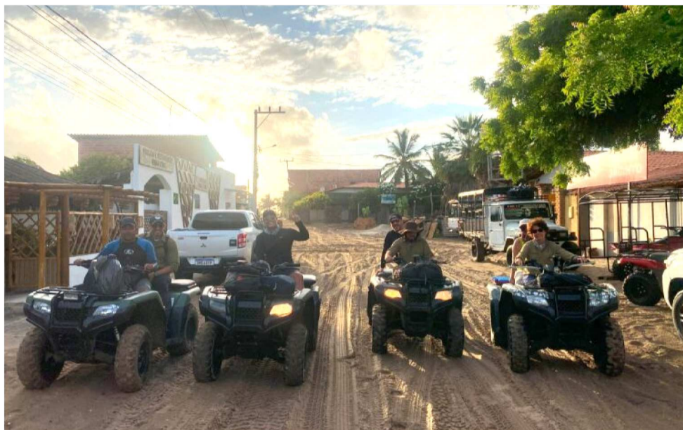
PROJETO PREVÊ PELO MENOS 20 AÇÕES PRESENCIAIS DE SENSIBILIZAÇÃO AMBIENTAL

Inspirado pelo sucesso de experiências da organização no Delta do Parnaíba, o projeto agora estende sua atuação ao município de Barreirinhas, nas comunidades de Atins, Ponta do Mangue e Queimada dos Britos, além de outras comunidades da Área de Proteção Ambiental Foz do Rio Preguiças, onde o turismo e os ecossistemas caminham juntos, mas nem sempre de forma harmoniosa. Com o ta-