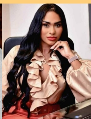
Operação Dinheiro Sujo: saiba quem são os influenciadores investigados por promover jogos de azar