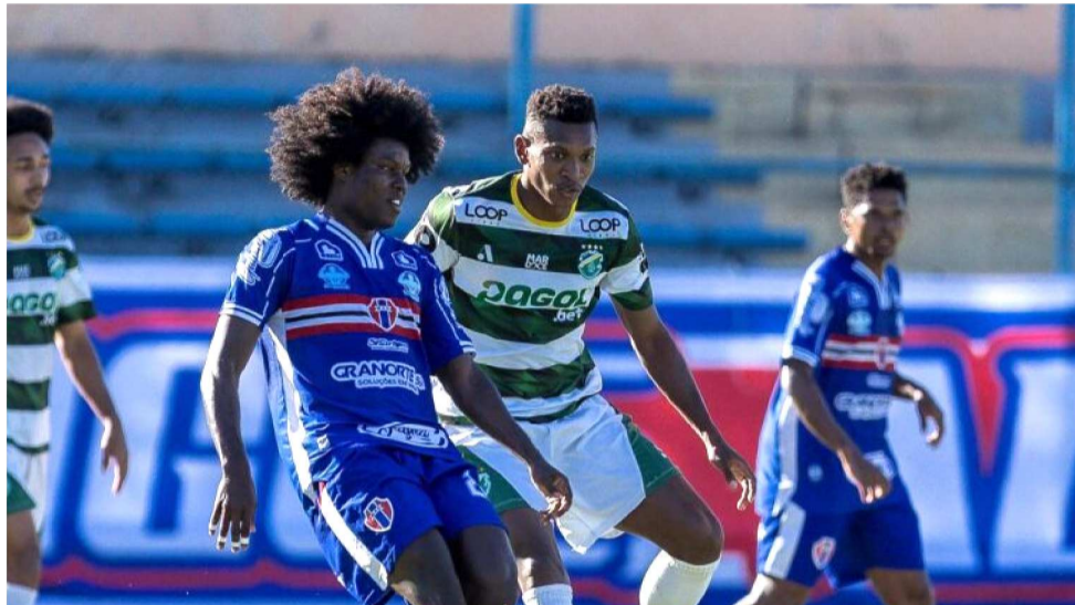
MARANHÃO ATLÉTICO CLUBE VAI ENCARAR A TUNA LUSO, NO ESTÁDIO CASTELÃO

A vitória no duelo inicial será muito importante para quem largar na van-