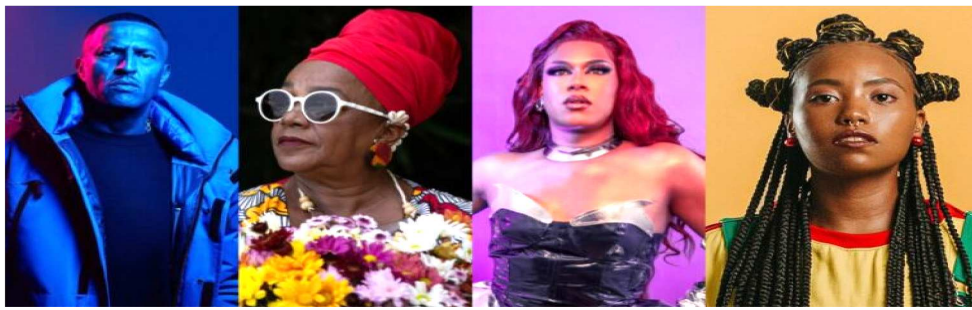
A PROPOSTA É CELEBRAR, VISIBILIZAR E FORTALECER A DIVERSIDADE DA MÚSICA NEGRA