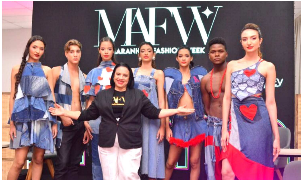
MAFW É UM DOS PRINCIPAIS EVENTOS DE MODA AUTORAL DO NORDESTE

Representando a Federação das Indústrias do Estado do Maranhão (FIE-