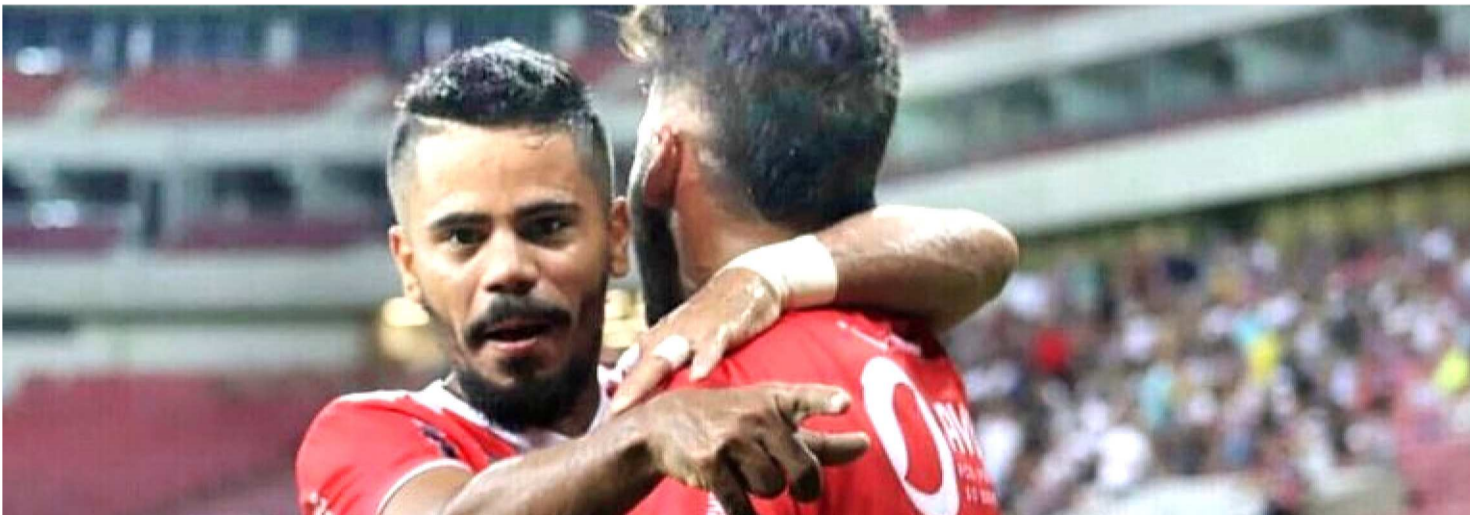
IMPERATRIZ COMEMORA O BOM RESULTADO NO JOGO CONTRA O MANAUS E VAI JOGAR DECISÃO EM CASA

Outro time maranhense que começou bem no primeiro mata-mata da Série D do Campeonato Brasileiro foi o Imperatriz. Jogando na tarde do último domingo, em Manaus, o Cavalo de Aço nem tomou conhecimento do mando de campo da equipe que tem o nome da cidade e venceu por 2 a 0, placar construído no primeiro tempo.