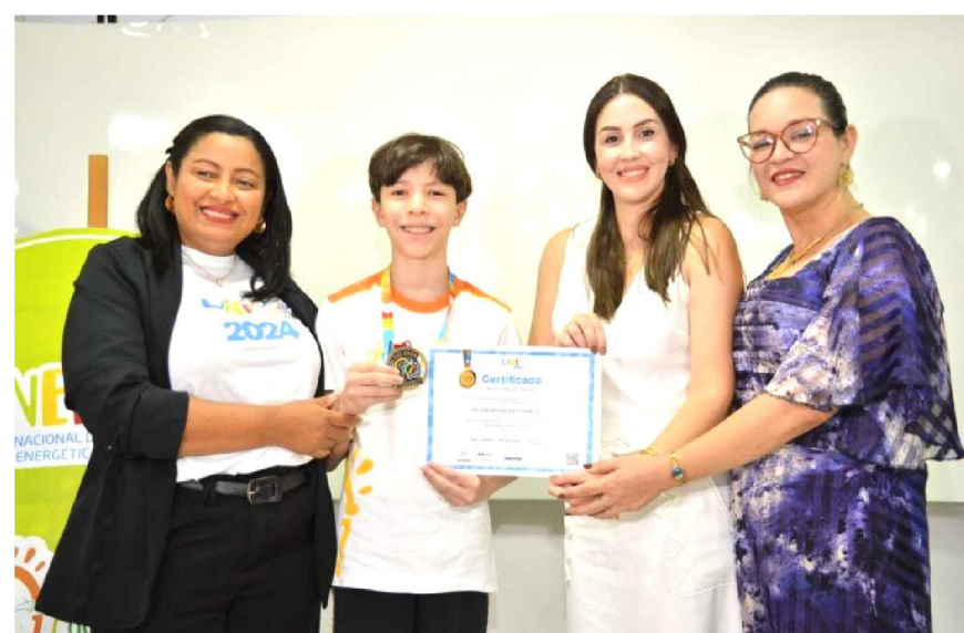
A Equatorial Maranhão é uma das parceiras da iniciativa e reforça seu compromisso com a promoção da educação e da sustentabilidade no nordeste