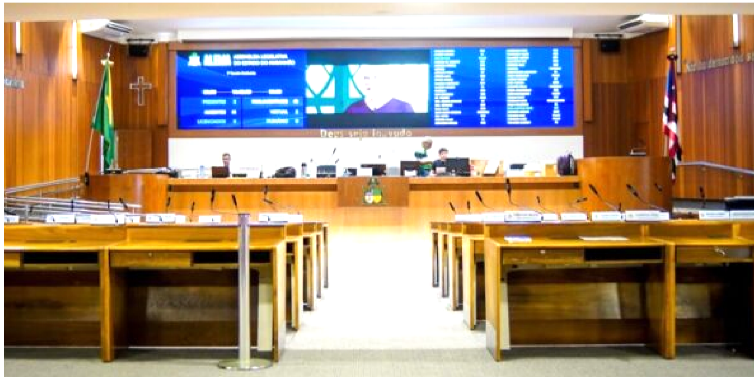
PLENÁRIO CONTA COM NOVOS SISTEMAS ELETRÔNICOS E BIOMÉTRICOS, NOVOS PAINÉIS DE VOTAÇÃO E TERMINAIS INTERATIVOS

A Assembleia Legislativa do Maranhão (Alema) retoma, nesta terça-feira (5), às 9h30, os trabalhos legislativos referentes ao segundo período da sessão legislativa de 2025. A sessão ordinária ocorrerá no Plenário Deputado Nagib Haickel, marcando o encerramento do recesso parlamentar regimental, que teve vigência de 18 a 31 de julho.