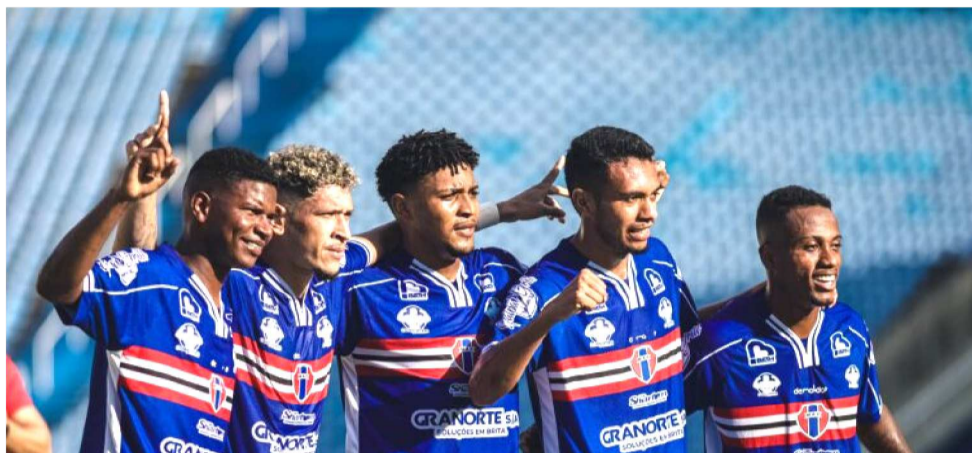
JOGADORES DO MAC ESTÃO CONFIANTE NA CLASSIFICAÇÃO PARA AS OITAVAS