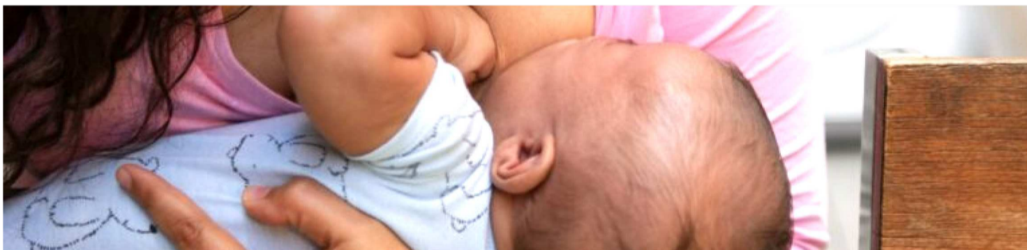
ENFERMEIRA DESTACA QUE LEITE MATERNO É ESSENCIAL PORQUE OFERECE NUTRIENTES, ANTICORPOS E CALORIAS PARA O BEBÊ

Segundo a Organização Mundial da Saúde (OMS), a amamentação exclusiva até os seis meses de vida poderia evitar 13% das mortes de crianças menores de cinco anos em todo o mundo. No Brasil, o Ministério da Saúde reforça que o leite materno é o alimento mais completo para os primeiros meses de vida, oferecendo nutrientes e anticorpos essenciais.