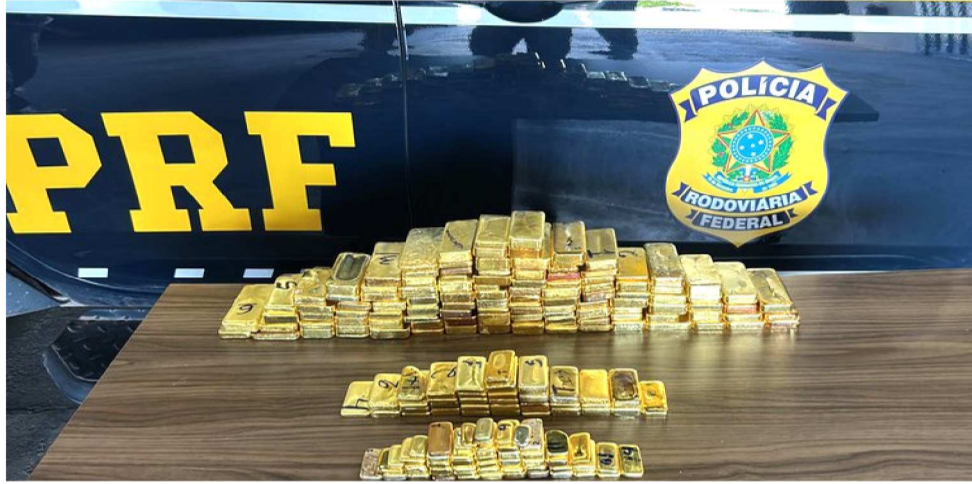
MAIS DE 100 BARRAS DE OURO ESTAVAM ESCONDIDAS DENTRO DO PAINEL DO VEÍCULO

As mais de 100 barras de ouro maciço que vinham de Rondônia e teriam como possível destino a Venezuela ou a Guiana, foram descobertas durante uma abordagem minuciosa na BR-401, nas proximidades da ponte dos Macuxis, em Boa Vista. O veículo, uma Toyota Hilux 2024, era conduzido por um homem de 30 anos, que viajava com a esposa e um bebê. Os agentes federais identificaram inconsistências na documentação apresentada, que não estava no nome do motorista. Após encontrarem uma pequena quantidade de ouro, aprofundaram a busca e localizaram mais de 100 bar-