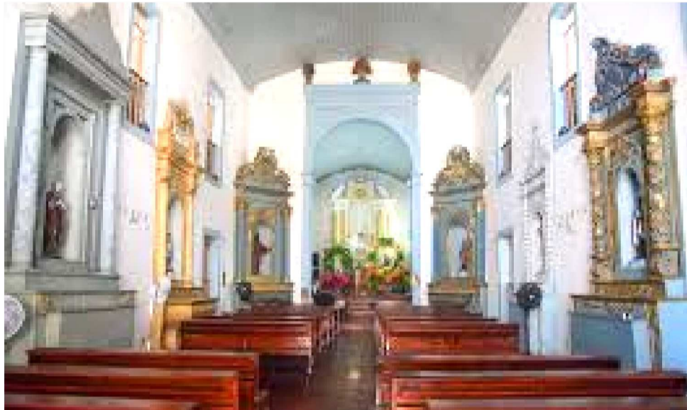
FESTEJO NA IGREJA NOSSA SENHORA DO ROSÁRIO DOS PRETOS SERÁ DE 07 A 11

A imagem, datada do século XIX, foi cuidadosamente restaurada após passar por um criterioso processo de