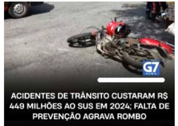
ACIDENTES DE TRÂNSITO CUSTARAM R$ 449 MILHÕES AO SUS EM 2024; FALTA DE PREVENÇÃO AGRAVA ROMBO

Quando o Instituto de Pesquisa Econômica Aplicada (Ipea) divulgou que o SUS gastou R$ 449 milhões em 2024 com vítimas de acidentes de trânsito, meu primeiro impulso foi de indignação.