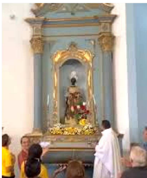
Festa em Alcântara Também na cidade de Alcântara, o

A igreja que data da construção do século XVIII, dedicada à Nossa Senhora do Rosário dos Pretos, abrigou a festa de São Benedito específica da Igreja Santo Antônio no início do século XX, que desde então o celebra no segundo domingo de agosto, quando saem em procissão dos dois andores