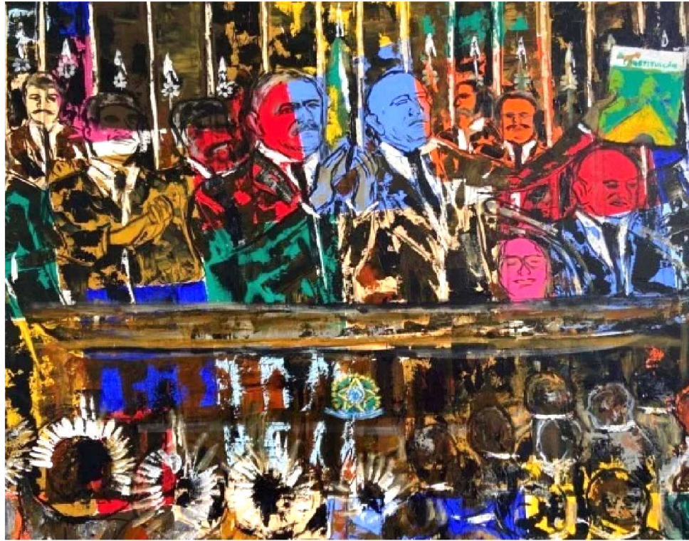
VISITANTES FARÃO UM PASSEIO VIRTUAL PELO CENÁRIO DE UMA DAS OBRAS EXPOSTAS