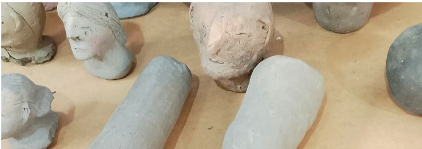
A EXPOSIÇÃO, DE LONGA DURAÇÃO, EXIBE PEÇAS QUE FAZEM PARTE DA EXPOSIÇÃO DAS CERÂMICAS E DAS COLEÇÕES ADJUNTAS

O Museu Casa de Nhozinho está recebendo a exposição “Ex-votos: Memórias da Fé”. Os ex-votos são objetos ofertados a divindades ou santos em agradecimento por graças alcançadas ou pedidos atendidos, comumente encontrados em contextos católicos, especialmente no Brasil. Esses objetos podem ser desde pinturas e estatuetas, até objetos pessoais ou representações do corpo humano, e são colocados em igrejas, santuários ou outros locais sagrados.