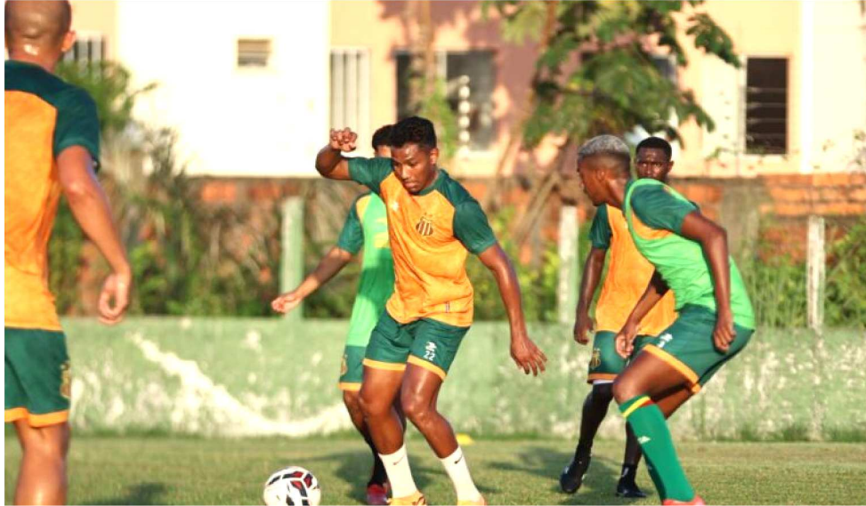
TIME DO SAMPAIO CORRÊA TREINOU COM MUDANÇAS EM TODOS OS SETORES