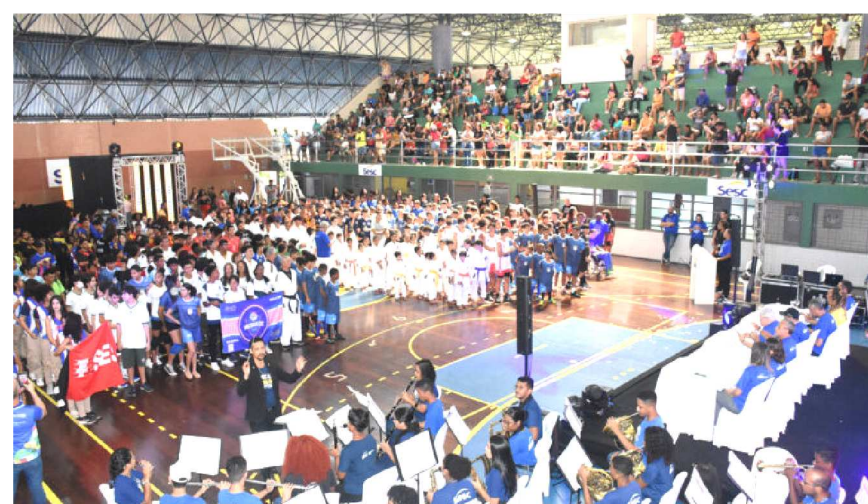
Registro da Abertura das Olimpíadas Sesc em 2024

Este ano, a competição conta com a participação de mais de 1300 atletas, divididos em 150 equipes, sendo 10 modalidades Olímpicas e sete Paralímpicas. As equipes competirão ao longo dos meses de agosto, setembro e outubro. O Sesc, instituição vinculada ao Sistema Fecomércio/Sesc/Senac, busca através deste projeto, reforçar a importância da prática esportiva como maneira efetiva para alcançar a saúde e o bem estar físico e social, ao mesmo tempo em que promove a inclusão e a integração entre os competidores; alunos de escolas públicas e privadas, estimulando o interesse pelas atividades esportivas.