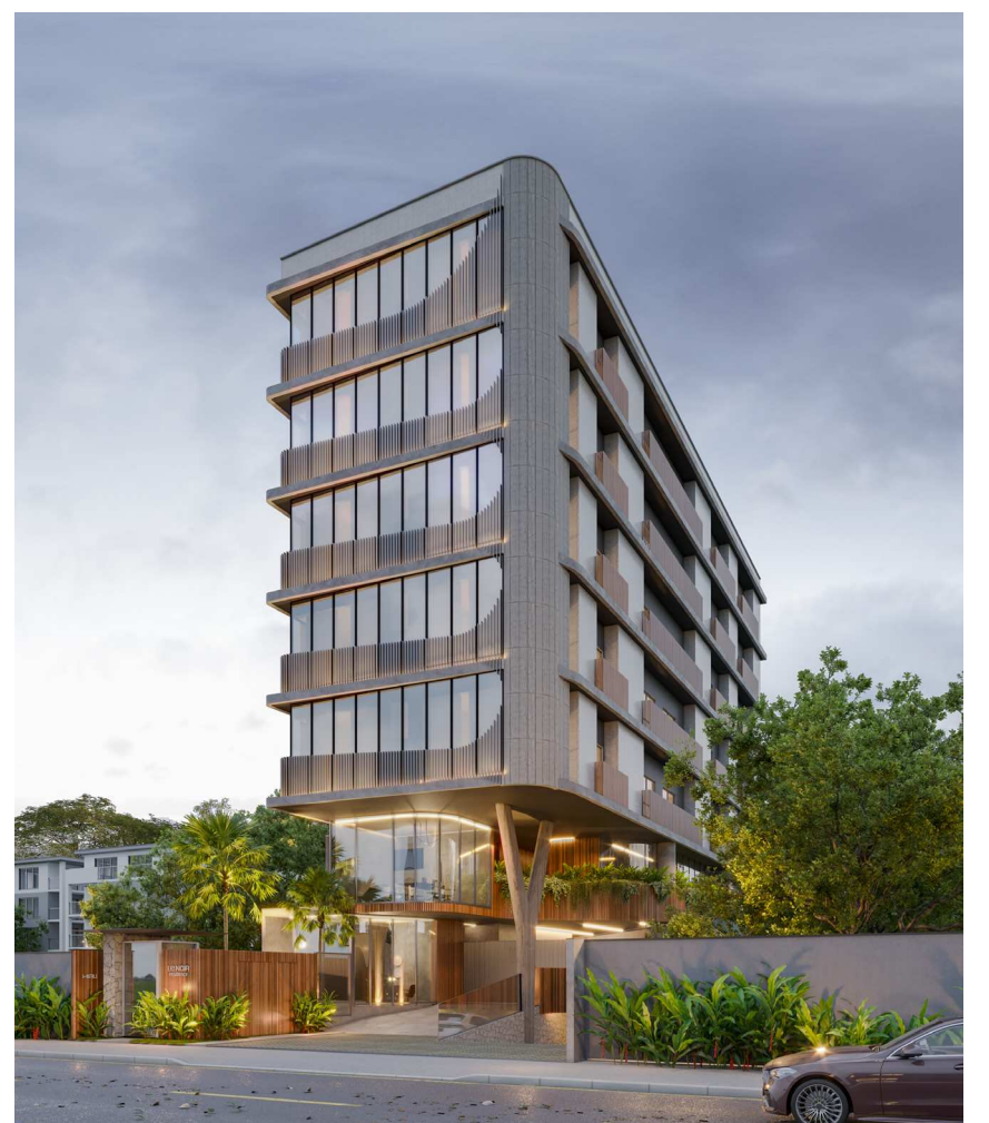
O Le Noir aposta também na tecnologia e na sustentabilidade

descartado, que enxerga potencial onde muitos viam limitação — e que propõe um modo mais íntimo e inteligente de se viver a cidade.