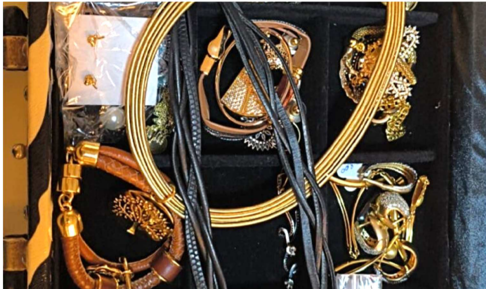
OPERAÇÃO LEI DO RETORNO APREENDEU JOIAS E DINHEIRO DOS INVESTIGADOS

As investigações apontam para um esquema em que parte do dinheiro pago em contratos firmados com ver-