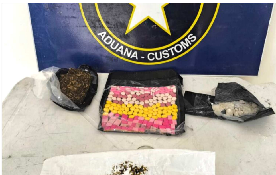
FORAM ENCONTRADAS TAMBÉM DROGAS SINTÉTICAS E OUTROS TIPOS DE SUBSTÂNCIAS

No Centro de Distribuição dos Correios, foram encontrados 200 comprimidos de ecstasy, 40g de haxixe, 20g