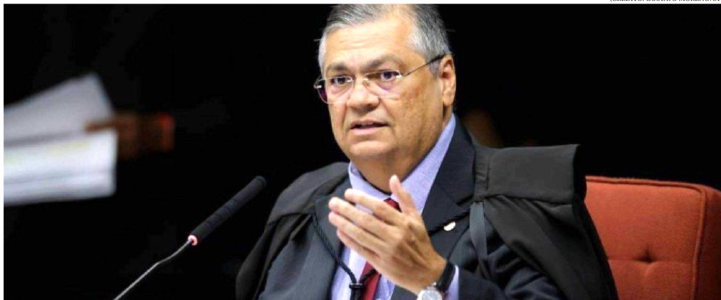
MINISTRO FLÁVIO DINO AFIRMOU QUE, APÓS A SEPARAÇÃO, IRÁ "ANALISAR AS PETIÇÕES PENDENTES"

Em despacho divulgado nesta terça-feira (26), o ministro do Supremo Tribunal Federal (STF), Flávio Dino, decidiu separar em duas peças processuais distintas os questionamentos em torno das nomeações para o Tribunal de Contas do Estado do Maranhão (TCE-MA).