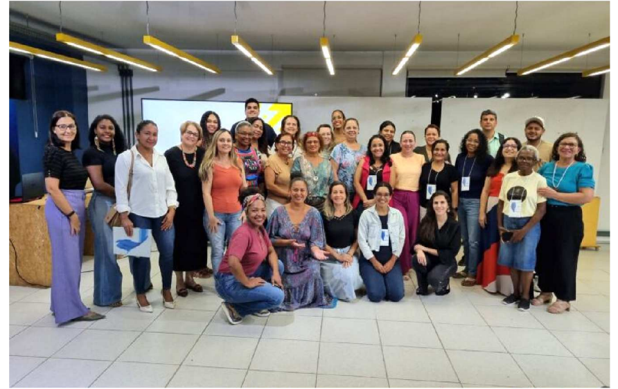
Empreendedores da primeira turma do Avançar MEI participam do Encontro Coletivo, realizado no Sebrae Lab em São Luís