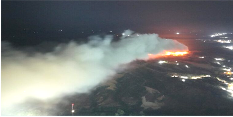
O INCÊNDIO NO LIXÃO DA CIDADE INICIOU NO ÚLTIMO DOMINGO, DIA 24 DE AGOSTO