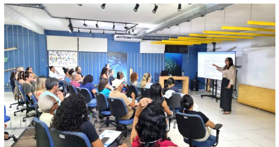
Palestras motivacionais marcaram o encontro, com foco em gestão e empreendedorismo para microempreendedores individuais