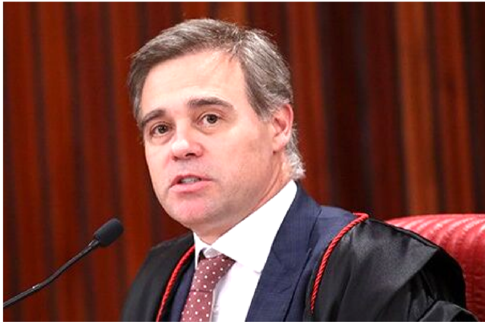
MINISTRO ANDRÉ MENDONÇA PRETENDE LEVAR ANÁLISE AO PLENÁRIO FÍSICO

pelo TSE, a decisão poderá impactar diretamente a atual composição da Assembleia Legislativa do Maranhão, onde o PSC conquistou, em 2022, dois