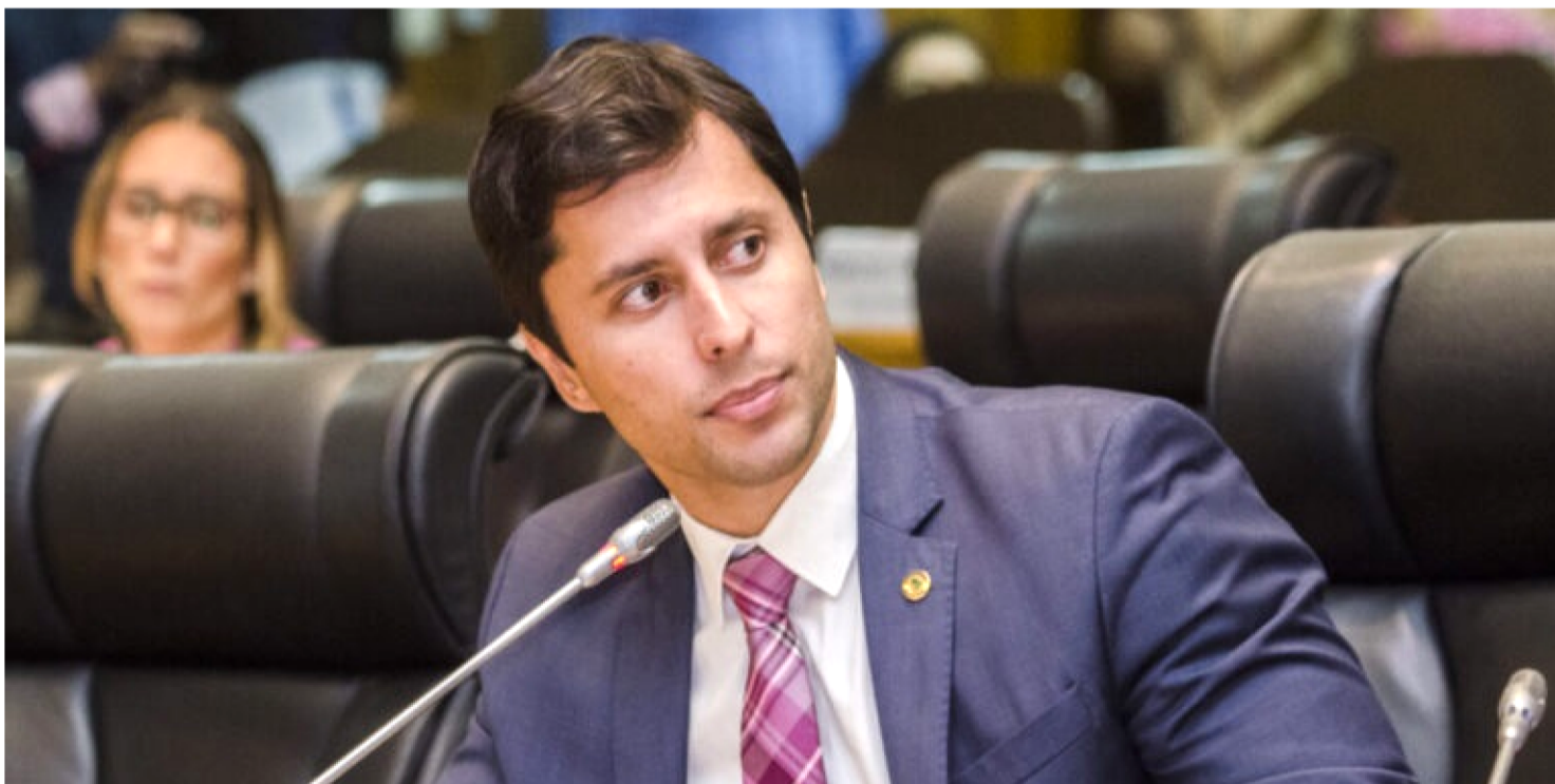
CARLOS VIANA (PODEMOS-MG) E DUARTE JR. (PSB-MA), SÃO, RESPECTIVAMENTE, PRESIDENTE E VICE-PRESIDENTE DA CPMI DO INSS

Consenso entre governistas e oposição, o deputado federal Duarte Júnior (PSB-MA) foi escolhido para ser o vice-presidente da Comissão Parlamentar Mista de Inquérito (CPMI) que vai investigar as fraudes no INSS.