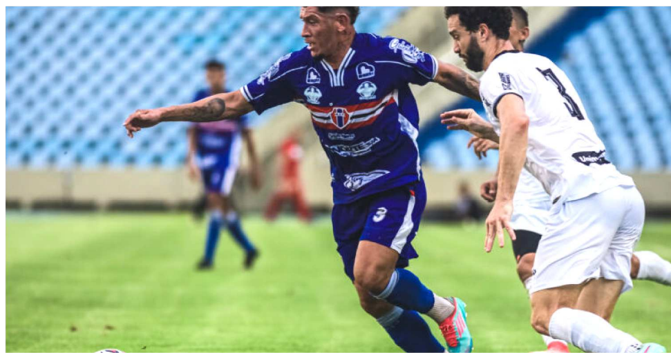
MAC RECEBE O ASA DE ARAPIRACA-AL NO PRÓXIMO SÁBADO NO ESTÁDIO CASTELÃO

O clube de Arapiraca só fez quatro (3 no Ferroviário e 1 no Manauara) no mesmo período. O forte da equipe de