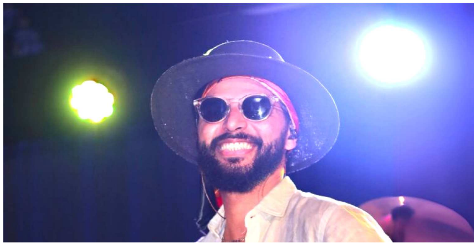
O EVENTO ACONTECERÁ NO NO REVIVER HOSTEL (CENTRO HISTÓRICO)

“O Baile nasceu desse desejo de transformar o show em uma festa coletiva, onde todo mundo se reconhece