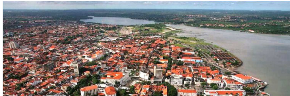
SÃO LUÍS PODE SER DECISIVA NA ESCOLHA DO PRÓXIMO GOVERNADOR EM 2026

Os números mais recentes reforçam o peso político da capital. No primeiro turno das eleições municipais de 2024, realizado em 6 de outubro, o Brasil teve 155.912.680 eleitoras e eleitores aptos a escolher prefeitos, vice-prefeitos e vereadores. No Maranhão, o total de votantes chegou a 5.180.738, dos quais 92,64% com biometria ca-