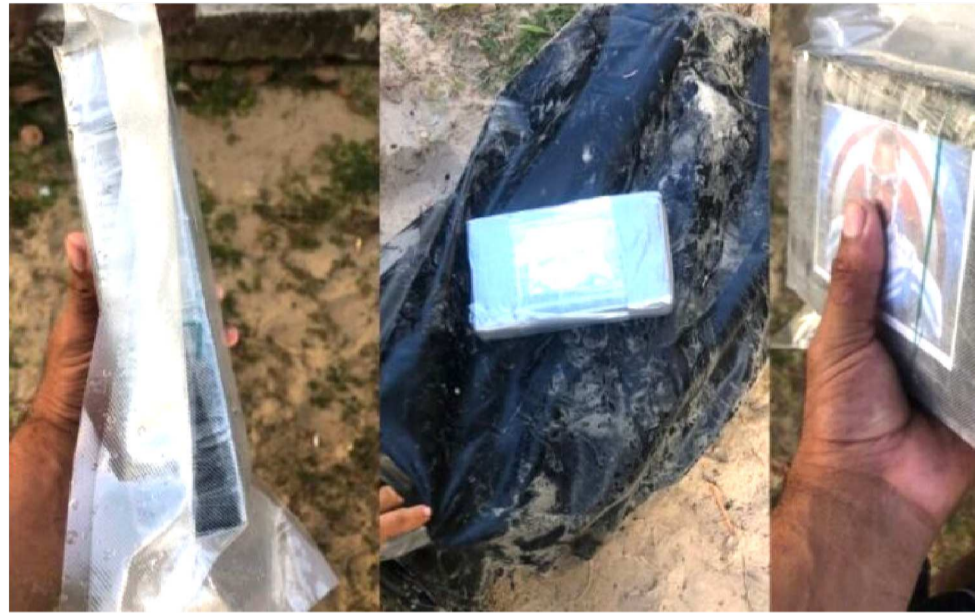
POLÍCIA FEDERAL, MILITAR E CIVIL SEGUEM INVESTIGANDO AS CIRCUNSTÂNCIAS DO CASO

Moradores da região também relataram que parte da carga não submersa teria sido saqueada, mas a informação ainda está em apuração pela Polícia Federal, que conduz as investiga-