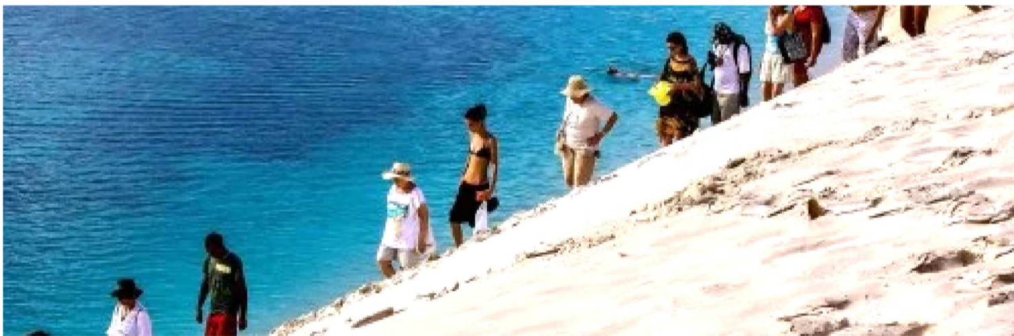
TURISMO DA REGIÃO JÁ CORRESPONDE POR 9,8% DO PIB DO NORDESTE, A MAIOR PARTICIPAÇÃO ENTRE AS REGIÕES BRASILEIRAS

O turismo no Nordeste alcançou, em 2024, o maior número de empregos formais dos últimos seis anos, superando os níveis registrados antes da pandemia. Foram 433,3 mil trabalhadores empregados no setor, o que corresponde a 18,6% das vagas de turismo em todo o país, de acordo com boletim temático inédito divulgado pela Superintendência do Desenvolvimento do Nordeste (Sudene) nesta sexta-feira (5). O documento reúne indicadores sociais e econômicos, destacando tanto o desempenho expressivo da Região quanto os desafios estruturais a serem enfrentados.