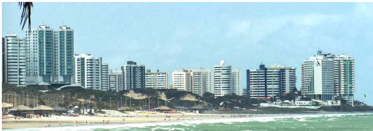
SÃO LUÍS CHEGA AOS 413 ANOS COM PROTAGONISMO HISTÓRICO E PESO ELEITORAL CRESCENTE QUE PODE SER DECISIVO NAS URNAS