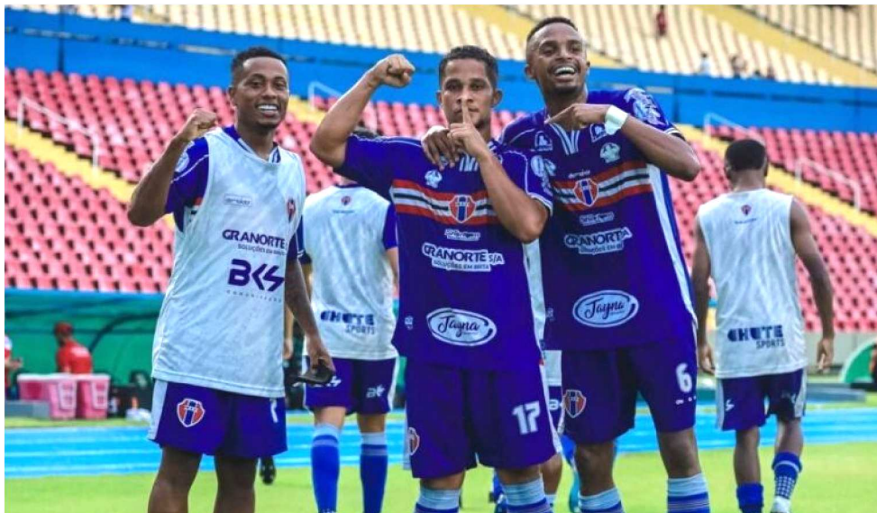
A COMEMORAÇÃO PODE SER REPETIDA HOJE EM ALAGOAS, ONDE O MAC QUER O ACESSO