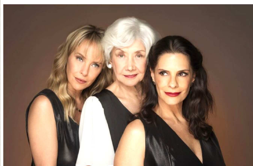
Clássico de Edward Albee se apresenta na capital maranhense nos dias 19, 20 e 21 de setembro, no Teatro Arthur Azevedo (TAA).