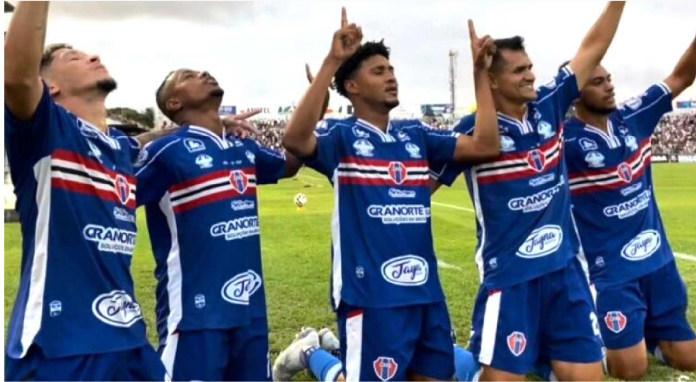
MARANHÃO COMEMORA O ACESSO À SÉRIE C DO BRASILEIRO