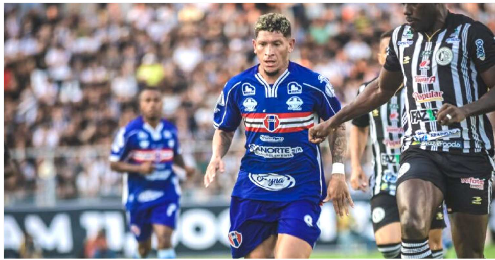
QUADRICOLOR FARÁ A PRIMEIRA PARTIDA EM SÃO LUÍS NO PRÓXIMO DOMINGO

A ideia de mudar o jogo para a capital da Paraíba, distante apenas 116 km de Recife, tinha o claro objetivo de levar ao estádio Almeida uma enorme quantidade de torcedores do clube