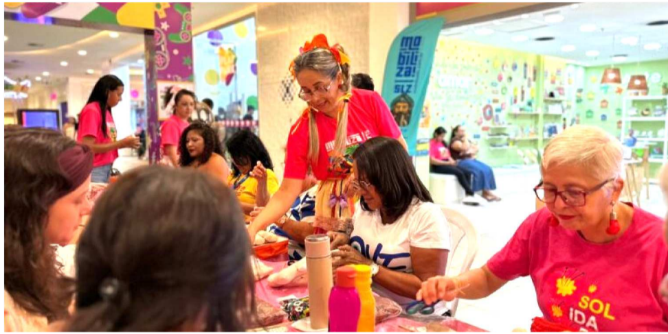
MOBILIZA SLZ TRAZ AGENDAS VOLTADAS AO DESENVOLVIMENTO DE MULHERES