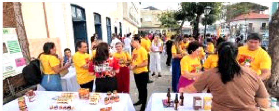
AÇÃO CONTOU COM SEBRAE MARANHÃO, FAPEMA, TROPOS LAB E AGÊNCIA MARANDU

Pela manhã, a programação do evento foi direcionada a 20 startups atendidas pelo Inova Cerrado, programa do Sebrae voltado à aceleração de empresas inovadoras da bioeconomia. Além de dinâmicas de interação entre os membros de cada startup, as atividades iniciais do Inova Ilha incluíram o lançamento do Fundo de Investimento (FIP) Nordeste Capital Semente, pelo Banco do Nordeste em parceria com a FINEP e o Sebrae. O