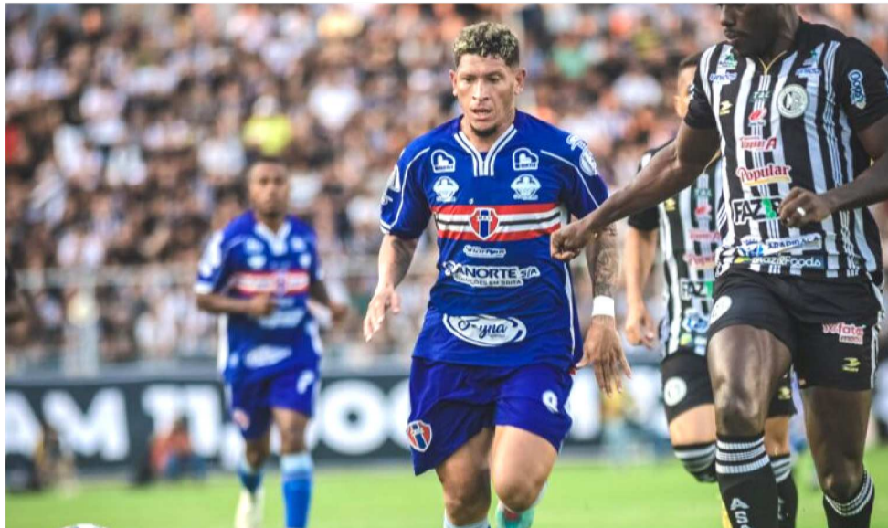
QUADRICOLOR FARÁ A PRIMEIRA PARTIDA DA SEMIFINAL EM SÃO LUÍS

O clima em meio aos jogadores e comissão técnica é de otimismo, apesar do respeito ao adversário. Além de tentar repetir as boas atuações em casa nesta reta final da competição, o MAC vai contar com o apoio de sua torcida, cuja previsão da diretoria é de que mais de dez mil atleticanos esta-