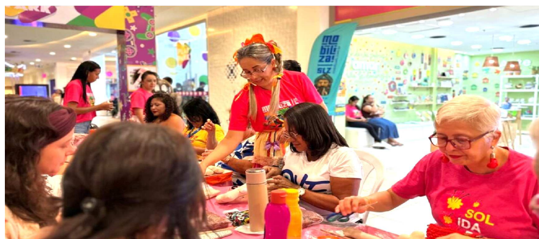
OFICINAS DO MOBILIZA EM VÁRIOS PONTOS DA CAPITAL

Assista alguns momentos no canal YouTube.com/mundopassaporte ou Instagram: @mdavicarvalho