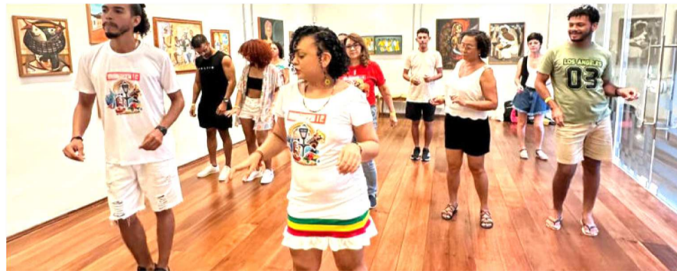
A POPULAÇÃO APROVEITOU FEIRAS, APRESENTAÇÕES MUSICAIS, OFICINAS E AÇÕES

Na sexta-feira (12), a cena musical foi agitada pelo “Baile do TG”, que reuniu mais de dez artistas a partir das 17h no Creole Bar, na Ponta d’Areia, com entrada gratuita até as 18h30. No mesmo dia, o Museu do Reggae, no Centro, sediou a oficina gratuita “Bailando com o Reggae Mania”, que ocorreu das 16h30 às 18h, e que exigiu inscrição prévia devido à capacidade