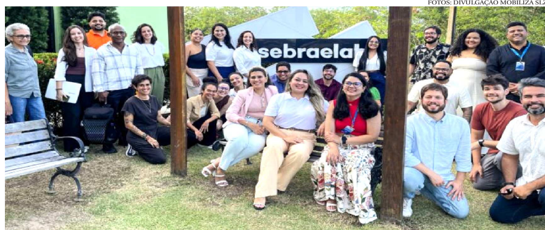
EMPREENDEDORES DO PROGRAMA INOVA CERRADO NO MOBILIZA SLZ 2025

Organizado anualmente pelo SEBRAE-MA, o Mobiliza é um movimento, que nasceu para fortalecer e celebrar o que nossa cidade tem de mais belo e representativo: Cultura, Turismo e Economia Criativa. Por meio de uma rede plural e transformadora, o Mobiliza promove a troca de ideias e experiências, conectando pessoas e inspirando mudanças.