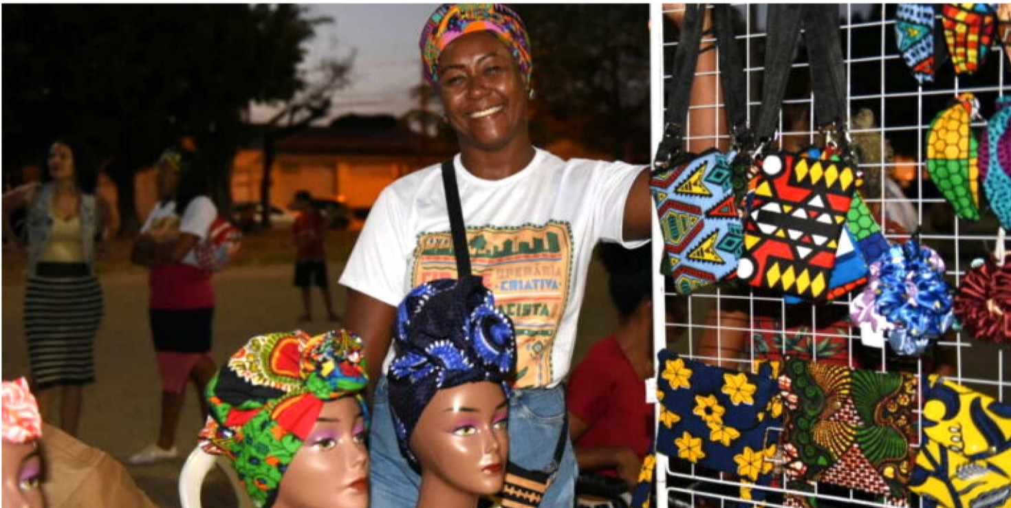
A FEIRINHA DE EMPREENDEDORISMO DO “MARANHÃO ANCESTRAL ‘RAÍZES INDÍGENAS’” SE CONSOLIDOU COMO VITRINE LOCAL

As feiras criativas foram um ponto alto do Mobiliza SLZ 2025. Na sexta-feira (12), a “Feirinha Cultural e Criativa da Madre Deus” animou o Largo de Santo Antônio, com mais de 25 expositores de artesanato, moda, design e literatura. Já a feira “Encontro de Brechós” ocupou a praça do Museu Ferroviário e Portuário do Maranhão (REFFSA) na sexta (12) e sábado (13), das 16h às 20h, reunindo mais de 100 negócios locais e artistas independentes.