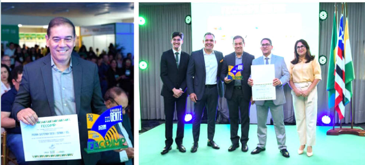
Estande do sistema FIEMA apresenta soluções voltadas para inovação, formação profissional e promoção da qualidade de vida