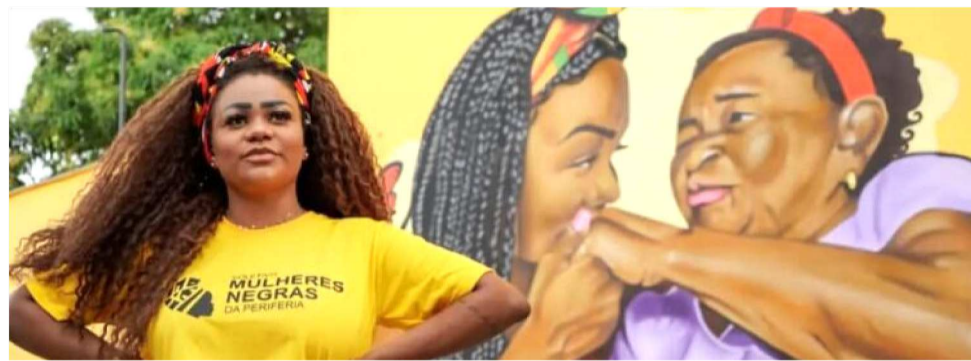
MAIS DE 3.000 PESSOAS ATENDIDAS EM AÇÕES DE ASSISTÊNCIA, EDUCAÇÃO E CULTURA

“Esses seis anos são de muita luta e resistência, mas também de muito orgulho. Nós, mulheres negras da periferia, não só sonhamos: nós realizamos. O coletivo é nossa contribuição para que a juventude e as crianças do território sintam menos o peso do racismo e tenham acesso à cultura, edu-