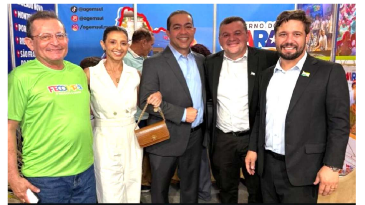
Staff AGEMSUL e o prefeito de Imperatriz, Rildo Amaral, com a primeira Dama, Perla Amaral

A 23ª edição da Feira do Comércio, Indústria e Serviços de Imperatriz (FECOIMP) foi aberta nessa quarta-feira (17) no Centro de Convenções da cidade, consolidando-se como o maior evento multissetorial de negócios do Norte e Nordeste. Com o tema "O Negócio é Gente", a feira deve atrair mais de 35 mil visitantes até o sábado (20), entre empresários, investidores, profissionais de diferentes áreas e o público em geral.