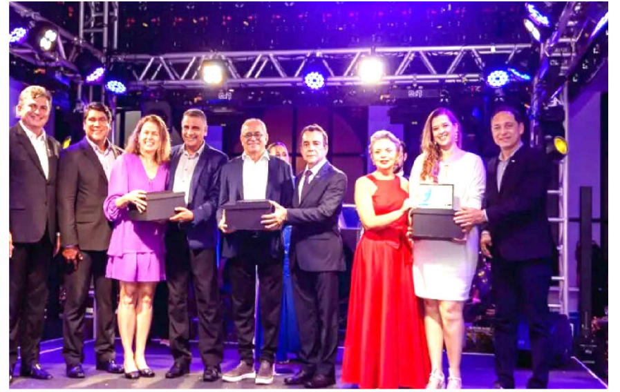
Premiação reconhece profissionais em quatro categorias e estudantes na categoria Jornalismo universitário