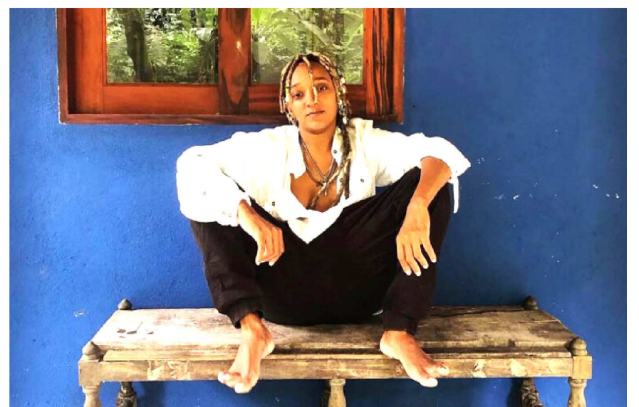
Tiyê Macau apresenta o espetáculo “Brinquedo: De Onde Surgem os Sonhos?”, nos dias 30 de setembro e 2 de outubro, terça e quinta, às 21h30, na Sala 2 do Sesc Campinas