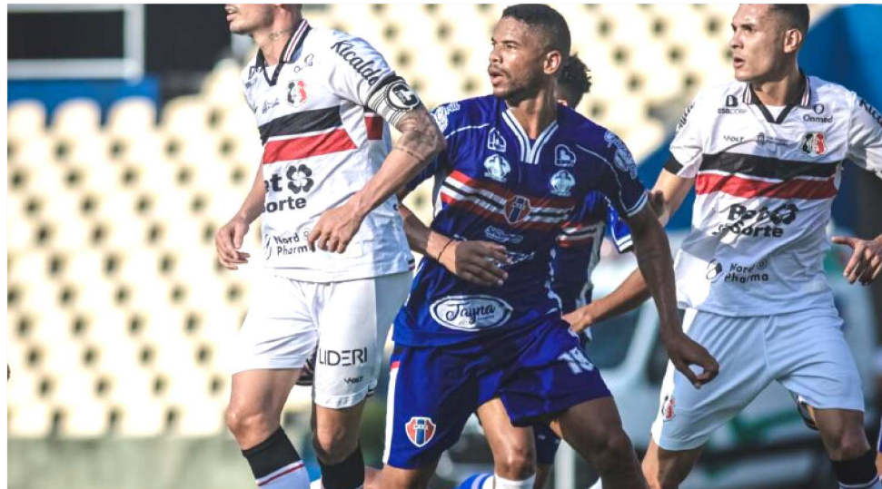
A INTENÇÃO DA DIRETORIA É MANTER A BASE DA EQUIPE PARA A TEMPORADA DE 2026