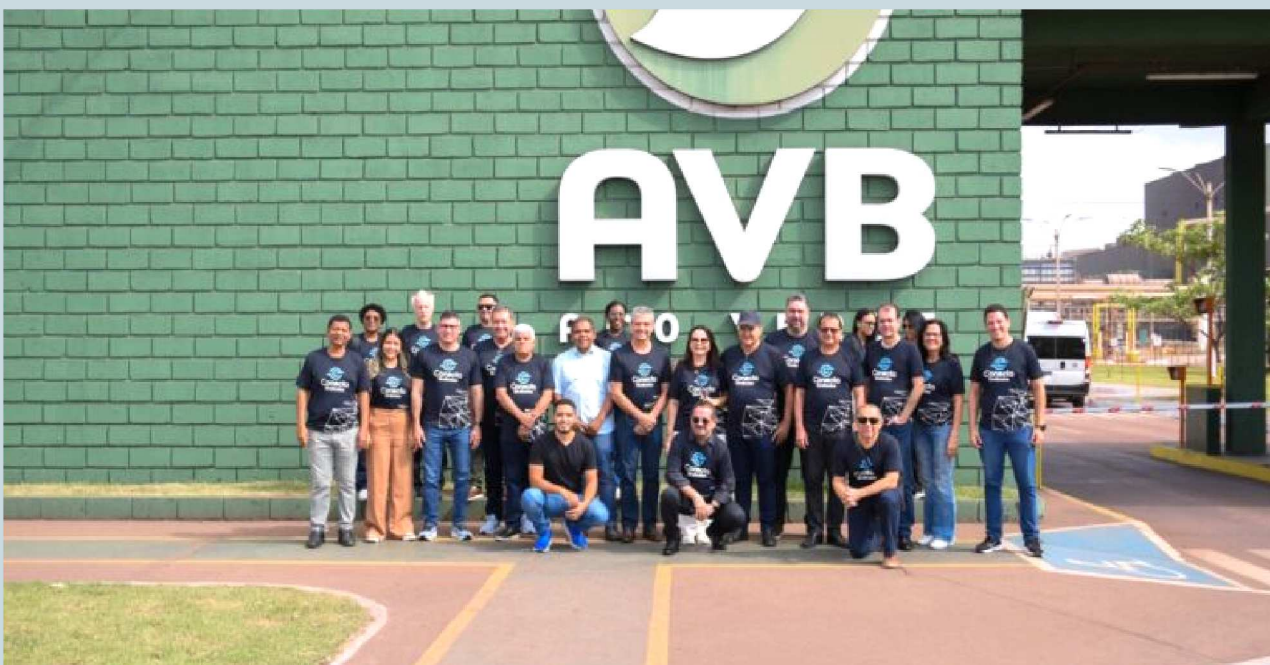
A agenda incluiu ainda palestra técnica de um representante da AVB sobre as “Oportunidades de Negócios na Cadeia Produtiva da AVB: Integração, Parcerias e Desenvolvimento Regional”, seguida de rodada de perguntas com os participantes. A comitiva de diretores também realizou uma visita às instalações da empresa, fortalecendo a integração entre a indústria e os sindicatos.