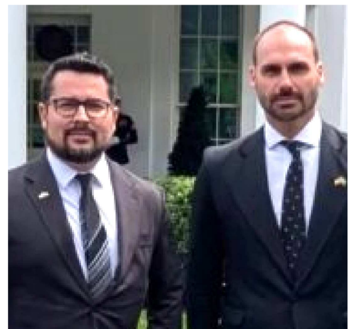
Denúncia foi feita no inquérito do STF que trata de atuação nos EUA

Já Eduardo Bolsonaro pediu licença da Câmara em março e foi morar no exterior sob a alegação de perseguição política.