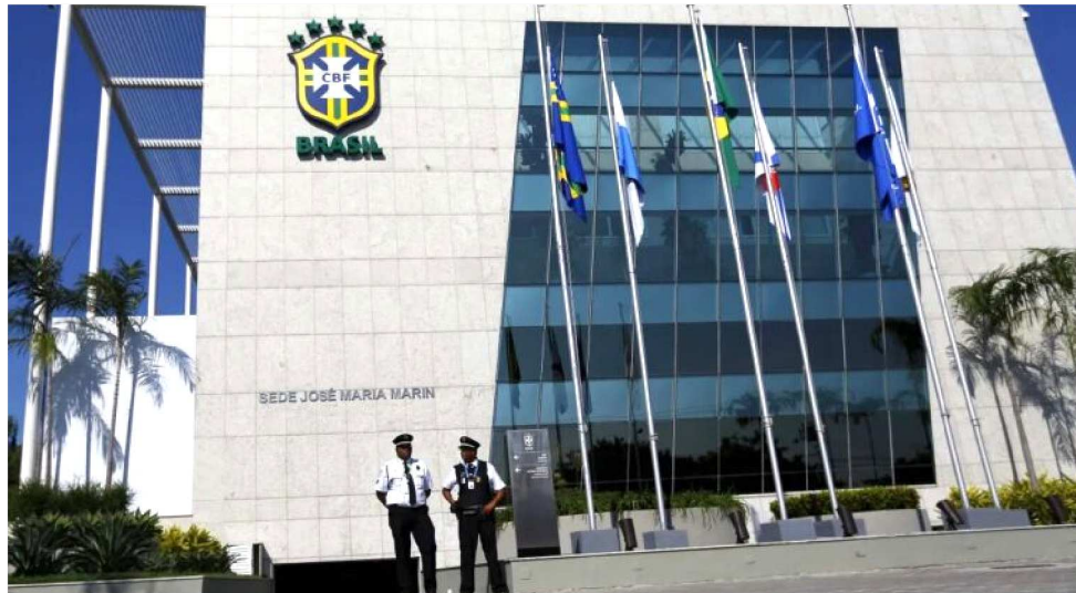
CBF RECEBEU MANIFESTO CONTRA AUMENTO DO NUMERO DE CLUBES DA SÉRIE D EM 2026

A divulgação das alterações que provocarão o aumento para 93 participantes é aguardada com ansiedade pelos dirigentes, pois com a aproximação do final desta temporada, os clubes precisam elaborar o planejamento que, por sua vez, depende da