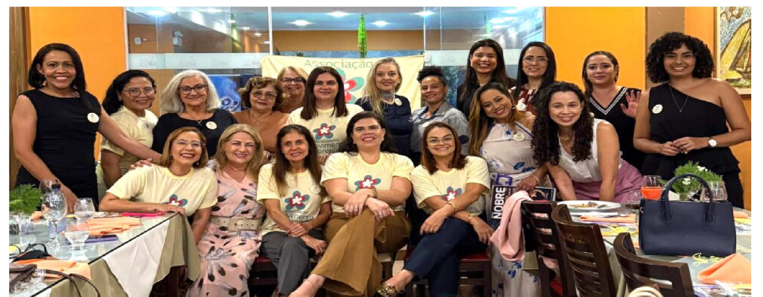
JANTAR DE NEGÓCIOS REUNIU EMPRESÁRIAS DA MEM