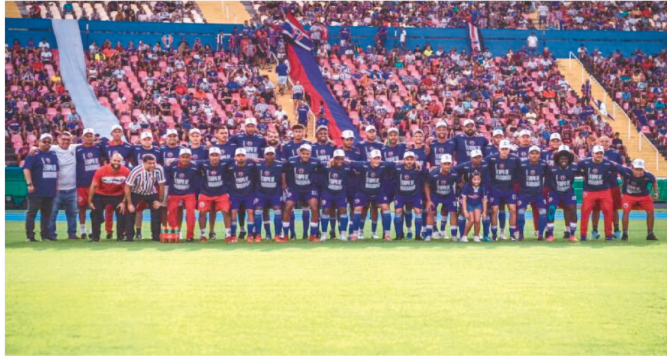
O MARANHÃO ATLÉTICO CLUBE FEZ UMA BELA CAMPANHA NA SÉRIE D DO BRASILEIRO