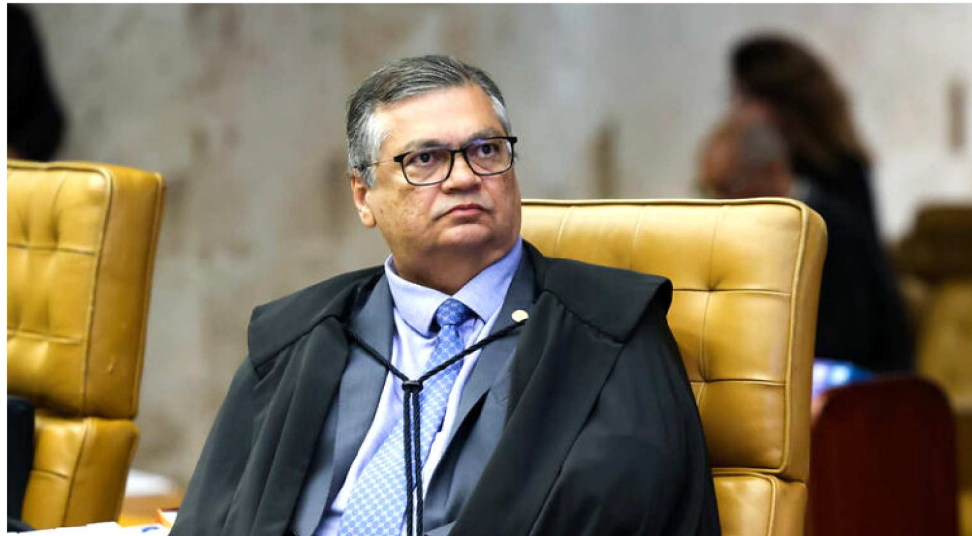
DINO NOTIFICA CBF A SE MANIFESTAR SOBRE O RECURSO APRESENTADO POR AMÉRICO

No mesmo despacho, Dino esclarece que até a apreciação do pedido de liminar, ficam impedidos quaisquer novos atos judiciais ou extrajudiciais, relativos à Federação Maranhense de Futebol, que impliquem mudanças estatutárias; alterações de gestão; mudanças de membros, filiados ou similares; realização de eleições. Ou se-