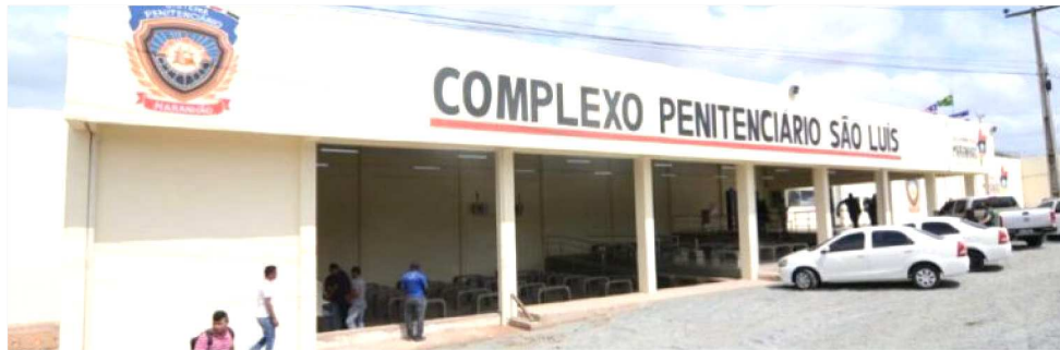
OS DETENTOS BENEFICIADOS DEVEM RETORNAR ATÉ ÀS 18H DO DIA 14 DE OUTUBRO

Os apenados e apenadas foram beneficiados com a saída temporária por preencherem os requisitos da Lei de Execução Penal. De acordo com o artigo 123 da lei, a autorização será concedida por ato motivado do juiz da execução, ouvidos o Ministério Público e a administração penitenciária. Para ter esse direito, o apenado ou apenada deve ter comportamento adequado; cumprido o mínimo de um sexto da pena, se o condenado for pri-