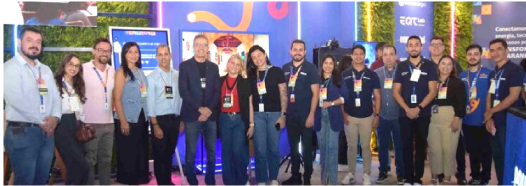
Estande da Equatorial foi um dos grandes destaque na Expo Indústria Maranhão 2025

A ligação de Donald Trump para o presidente Lula da Silva na manhã desta segunda-feira (6) foi tratada por aliados como uma vitória para o petista. Para a oposição, que esperava ainda mais pressão, foi um balde de água fria.