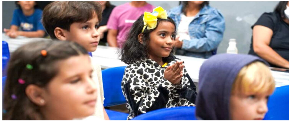
FEIRA SURGE COMO ESPAÇO DE VALORIZAÇÃO DA PRODUÇÃO LITERÁRIA MARANHENSE

O evento promove ainda um contato direto entre escritores, ilustradores, artistas e o público infantil, criando uma ponte entre o encantamento da leitura e a diversidade cultural do Maranhão.