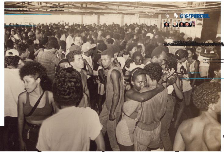
Um clube de reggae na capital (1993) Ponta dá areia. Os clubes de reggae, geralmente localizados próximos às praias, reuniam centenas de pessoas em todos os finais de semana

FMRB realiza a 1ª Feira do Livro Infantil Maranhense A feira surge como espaço de valorização da produção literária maranhense, reunindo 15 autores locais, que terão oportunidade de expor e comercializar suas obras.