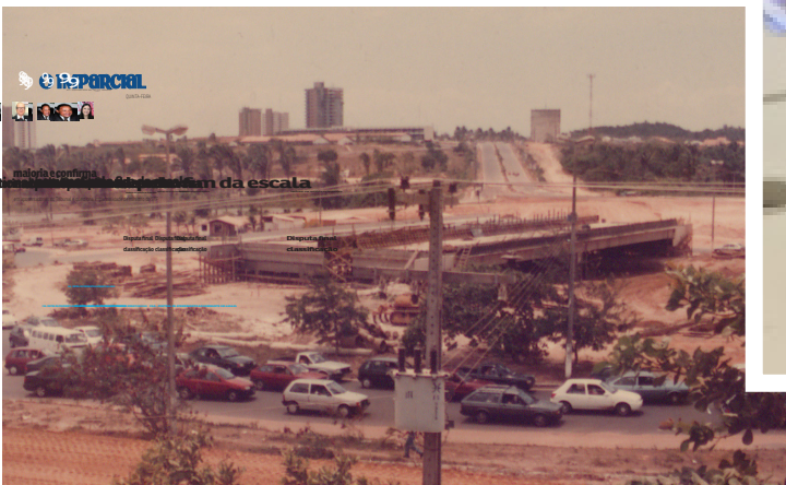
Construção do Elevado do Trabalhador (1997) - Localizada nas proximidades do Comando Geral da PMMA, a obra teve importância fundamental para a região, contribuindo para a melhoria do fluxo viário.