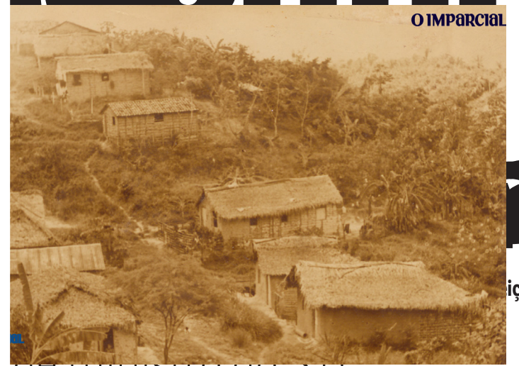
Bairro do Sá Viana (1979)