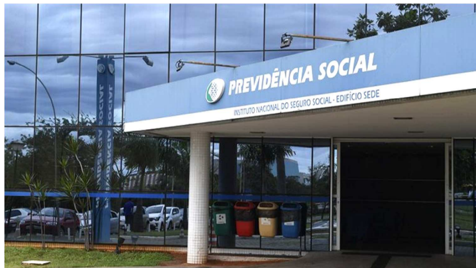
O PROGRAMA FOI SUSPENSO POR CONTA DE FALTA DE VERBAS DO GOVERNO

A medida tem efeito imediato. A interrupção paralisa o principal esforço do governo para reduzir a fila de mais de 2,63 milhões de solicitações, segundo os dados mais recentes, de agosto. Pressionada por uma greve de 235 dias de médicos peritos do INSS, a fila de espera aumenta desde o ano