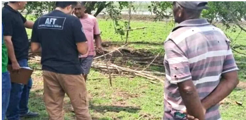
OS TRABALHADORES FORAM RESGATADOS EM UMA OPERAÇÃO NACIONAL

A Operação Nacional Resgate V, realizada de 15 de setembro a 10 de outubro, resultou no resgate de dez trabalhadores em três propriedades rurais do Maranhão.