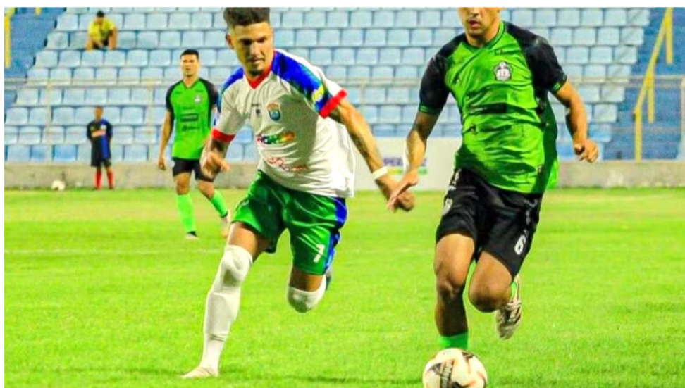
AS EQUIPES QUE VECERAM O PRIMEIRO CONFRONTO TEM A VANTAGEM AGORA

Concluídos os primeiros jogos da fase semifinal da Série B do Campeonato Maranhense, duas equipes largaram na frente e estão mais próximas da grande Final da competição que dará acesso à primeira divisão em 2026. O São Luís venceu o Luminense por 1 a 0 e o ITZ Sport derrotou o Lago Verde por 2 a 1. Os vencedores agora precisam apenas do empate no próximo domingo para garantir a classificação. Para modificar esse panorama, os perdedores vão ter que inverter os placares, construindo uma diferença superior a um gol. Os duelos decisivos serão disputados em São Luís (Nhozinho Santos) e São Mateus (Pinheirão), a partir das 15h30. Apesar das vantagens construídas pelos ganhadores do jogo da ida, de um modo geral entende-se que a classificação está "em aberto", em função do rendimento apresentado pelas equipes durante a