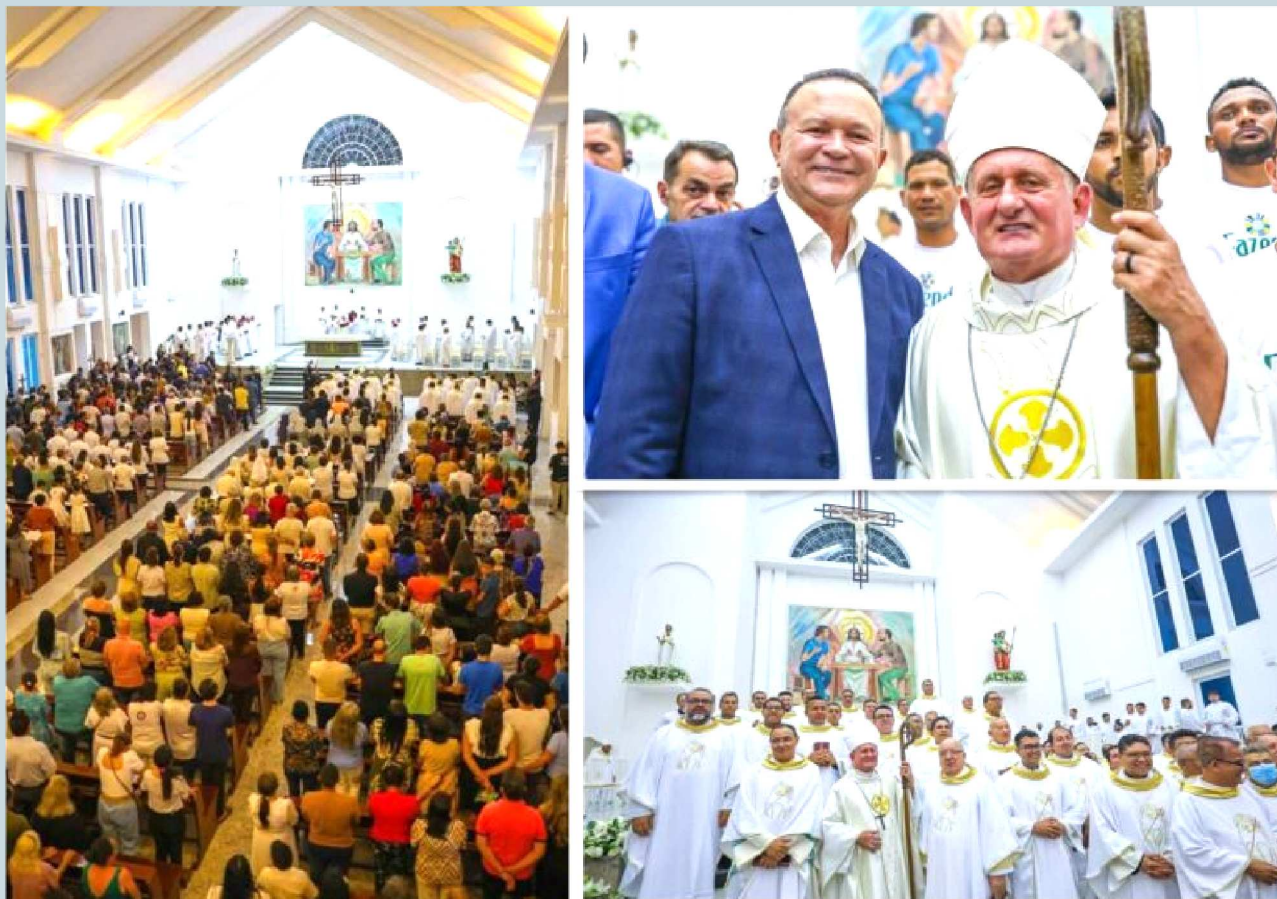
A missa de dedicação representa o testemunho da fé e união comunitária, fortalecendo a missão evangelizadora da Diocese de Imperatriz. Além da espiritualidade, o trabalho de revitalização da catedral é um marco histórico e cultural para a cidade e toda a região Tocantina. Também participaram da celebração bispos das dioceses do Maranhão, Pará e Tocantins, cerca de 100 sacerdotes, além de religiosos, fiéis e autoridades municipais e estaduais

A noite de segunda-feira (13) foi de celebração, fé e devoção em Imperatriz, com a reinauguração da Catedral de Nossa Senhora de Fátima, na cidade. O momento solene foi marcado por uma missa de dedicação celebrada pelo arcebispo de Imperatriz, Dom Vilsom Basso, e contou com a presença do governador Carlos Brandão. A catedral foi reinaugurada após dois anos de obras que revitalizaram toda a estrutura do templo. O governador Carlos Brandão destacou a importância da obra para toda a comunidade católica da Região Tocantina. "Esta foi uma reforma que teve a participação da sociedade civil organizada, dos comerciantes, dos empresários e do Governo do Maranhão. Todos colaboraram para esta causa. E hoje recebemos de volta esta linda catedral, que é uma réplica da Catedral de Fátima, em Portugal. Um cartão-postal que vai fortalecer o turismo religioso, Este é um momento de emoção e alegria para toda a comunidade", assinalou Brandão. O arcebispo de Imperatriz, Dom Vilsom Basso, falou da alegria de reinaugar a catedral. "Além de ser uma obra de fé, esta catedral é um espaço de cultura e acolhimento. Aqui, temos um museu, uma praça cheia elementos culturais e religiosos. Acreditamos, sim, que a gente oferece tanto para Imperatriz quanto para o Estado do Maranhão uma obra que vai ser um ponto turístico, movimentando o comércio local. Por isso, estamos felizes e agradecidos a todos que colaboraram com esta obra", declarou.