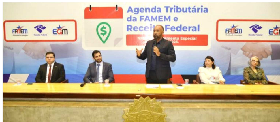
ENCONTRO REUNIU PREFEITOS, SECRETÁRIOS, PROCURADORES, E CONTROLADORES